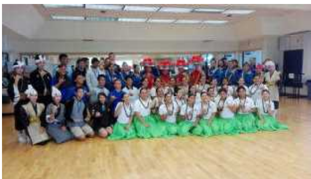
カメハメハ高校にて 伝統芸能交流会