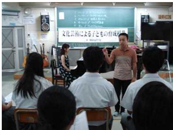
楽器演奏鑑賞及び体験 (沖縄県立那覇西高等学校)