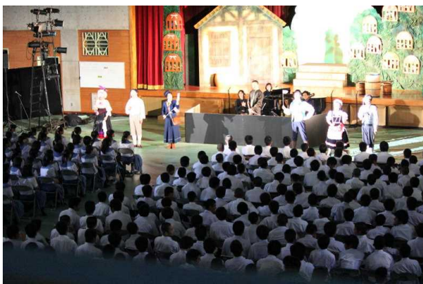
オペレッタの鑑賞 (沖縄市立コザ中学校)