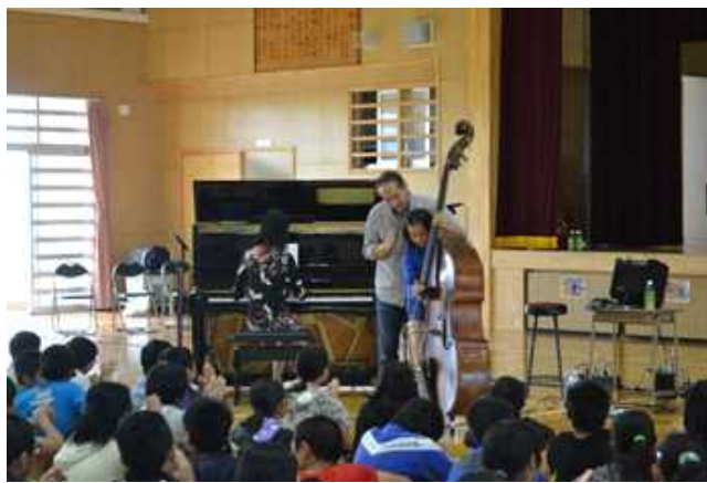
楽器演奏鑑賞及び体験 (宮古島市立久松小学校)