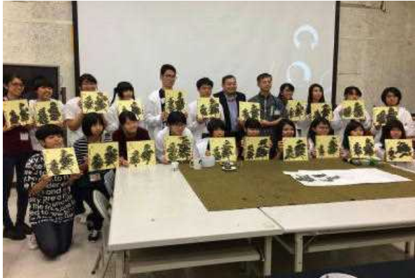
台湾芸術大学での水墨画研修