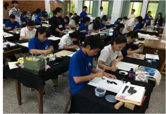
師範大附属での書道交流