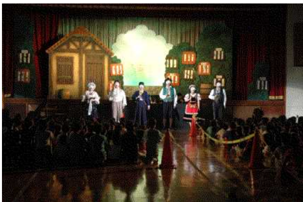
オペレッタの鑑賞の体験 (糸満市立光洋小学校)