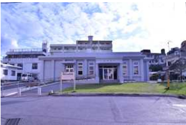
沖縄県鉄道与那原駅跡資料館

また、近年の調査成果として、駅舎跡付近においてレールやレールを枕木に固定する犬釘等の線路遺構や遺物もみつかり、近代沖縄における鉄道を中心とした交通の歴史を知る上で意義深い発見となっている。