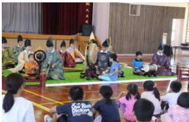
雅楽の鑑賞及び体験 (竹富町立波照間小中学校)