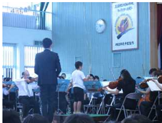
オーケストラ指揮体験 (石垣市立大浜小学校)