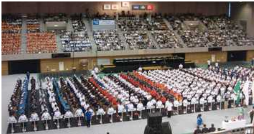
平成29年度全国高等学校総合体育大会総合開会式