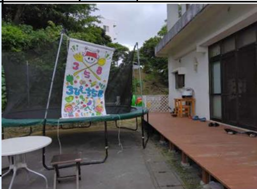
外観、設備等 (写真2枚程度)