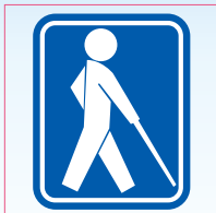
視覚障害者のための 国際シンボルマーク

視覚障害者の安全やバリアフリーに考慮された建物、設備、機器などに付けられている。