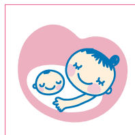
マタニティマーク

外観からは判断されにくい障害や疾患などがある人が、支援や配慮を必要としていることを周囲に知らせるマークです。