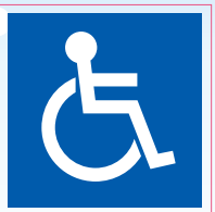
障害者のための 国際シンボルマーク

障害者が利用できる建築物、施設であることを示している。すべての障害者を対象としている。