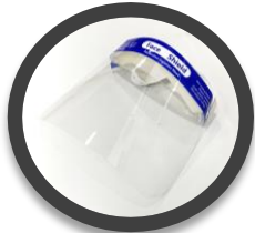
フェイスシールド