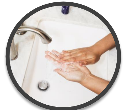
石けん + 流水