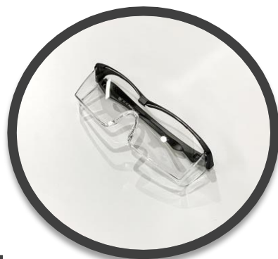
アイゴーグル または