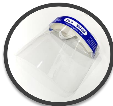
フェイスシールド