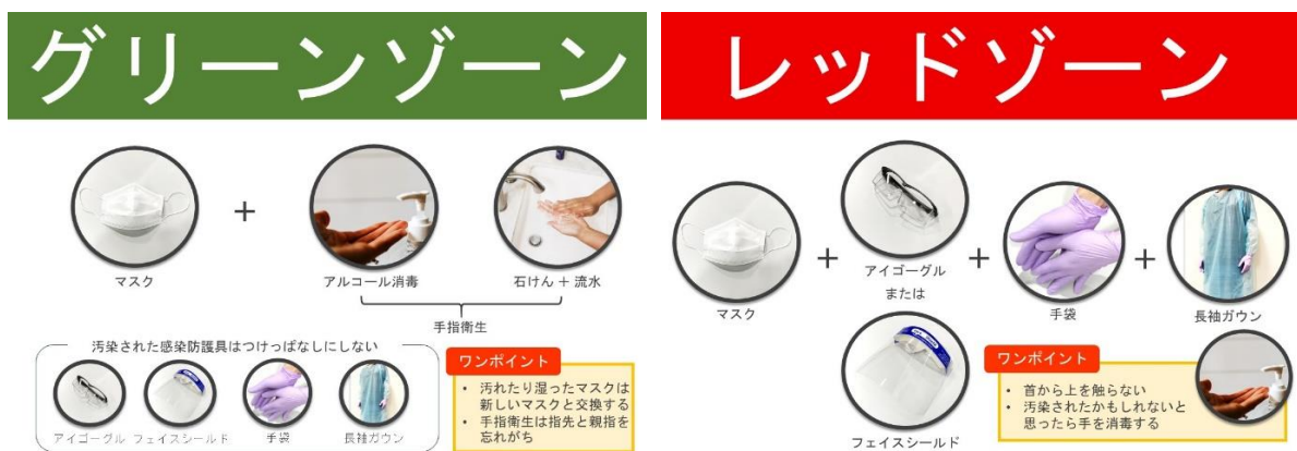
図3 各ゾーンで着用する个人防护具と手指衛生（別添を印刷して掲示してください）