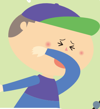
咳エチケットも忘れないでね