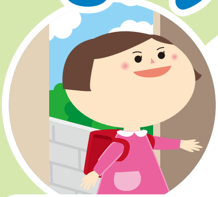
外から帰ったあと