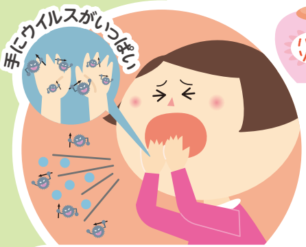
咳やくしゃみを手で おさえてしまったあと