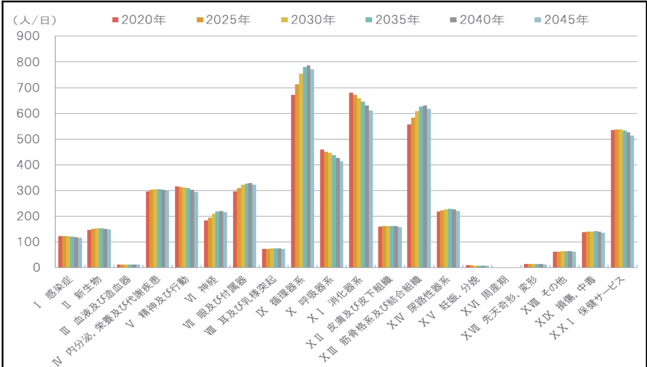
5 6 図表4 北部医療圏 疾病分類別病院外来患者数予測

1 2 また、外来患者数の将来予測においては、神経系の疾患、眼及び付属器系疾 3 患、循環器系疾患並びに筋骨格系及び結合組織系疾患患者の増加が見込まれて 4 います。(図表4参照)