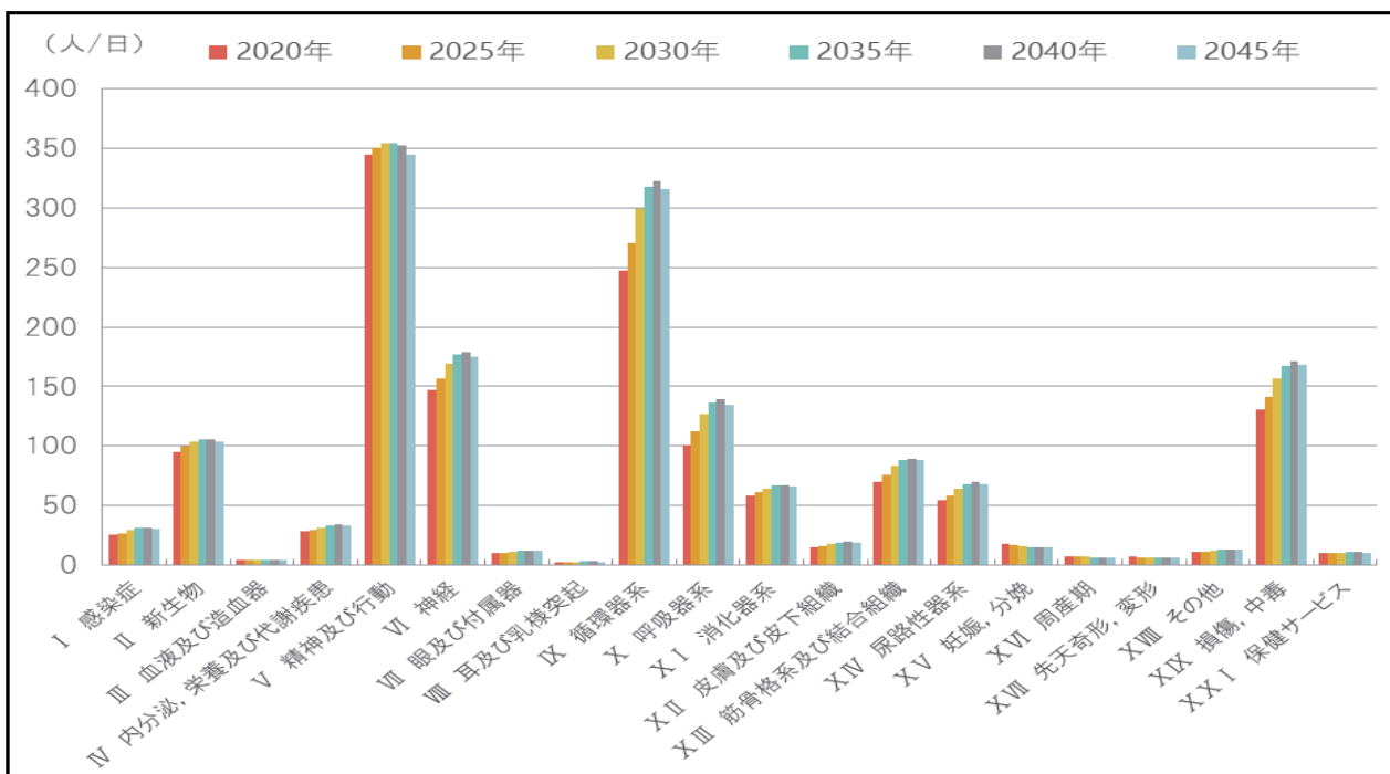
22 図表3 北部医療圏 疾病分類別病院入院患者数予測 23

20 入院患者数の将来予測においては、神経系の疾患、循環器系疾患、呼吸器系疾 21 患及び損傷、中毒系疾患患者の増加が見込まれています。(図表3参照)