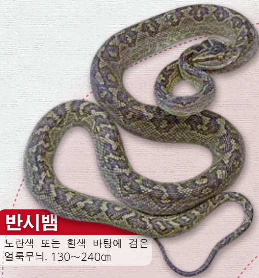
반시뱀 노란색 또는 흰색 바탕에 검은 얼룩무늬. 130~240cm

반시뱀 피해 중 산림에서 발생하는 경우는 전체의 약 5%로 적은 편입니다. 하지만 산 속에서 물리면 병원까지 이동하는 데 시간이 걸리므로 특별히 주의하십시오.