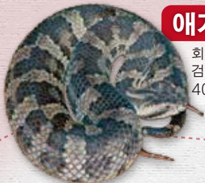
애기 반시뱀 회색 또는 갈색 바탕에 검은 얼룩무늬. 40~80cm