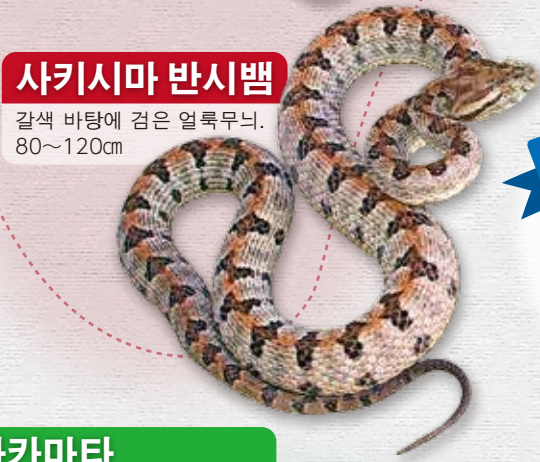
사키시마 반시뱀 갈색 바탕에 검은 얼룩무늬. 80~120cm