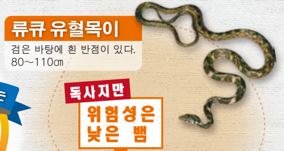
류큐 유혈목이 검은 바탕에 흰 반점이 있다. 80~110cm