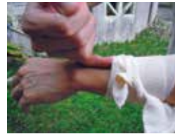
손가락이 하나 들어갈 정도로 느슨하게 묶는다.

붕대나 넥타이 등 끈 형태의 폭이 넓은 천으로 천으로, 물린 부위에서 심장에 가까운 쪽을 피가 잘 통하지 않을 정도로만 느슨하게 묶습니다. 15분에 한 번씩 헐겁게 해 줍니다. 절대 가는 끈 등으로 세게 묶으면 안 됩니다. 독이 퍼질까 무서워 세게 묶으면 혈액순환이 멈춰 역효과를 일으키기도 합니다.