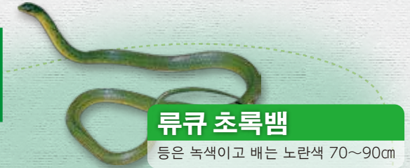
류큐 초록뱀 등은 녹색이고 배는 노란색 70~90cm