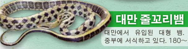
대만 즐꼬리뱀 대만에서 유입된 대형 뱀. 오키나와 중부에 서식하고 있다. 180~270cm