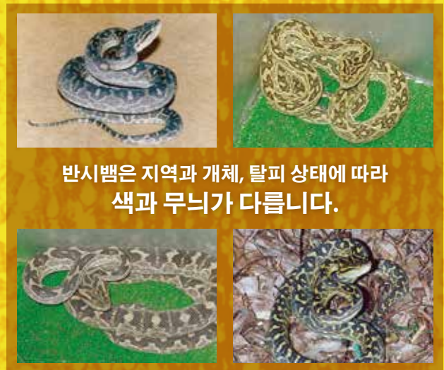
반시뱀은 지역과 개체, 탈피 상태에 따라 색과 무늬가 다릅니다.

오키나와현의 육지에는 24종의 뱀이 서식하고 있으며 독사는 8종류지만, 그 중 위험한 뱀은 반시뱀, 애기 반시뱀, 사키시마 반시뱀, 대만 반시뱀 이렇게 4종류 뿐입니다.