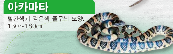
아카마타 빨간색과 검은색 줄무늬 모양. 130~180cm