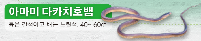
아마미 다카치호뱀 등은 갈색이고 배는 노란색. 40~60cm