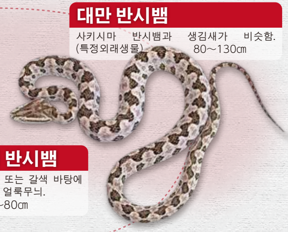
대만 반시뱀 사키시마 반시뱀과 생김새가 비슷함. (특정외래생물) 80~130cm