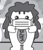
沖縄県選挙 キャラクター キジmun

有権者の皆様につきましては、投票所におけるマスク着用、咳エチケットの徹底をお願いいたします。