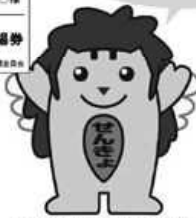
※投票入場券の様子は市町村によって異なります。