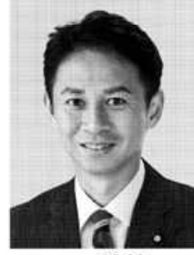
たに あい 現 党政務調査会副会長、参院議員2期、京都大学大学院修士課程修了、43歳。 人間を守る。時代を開く