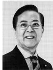
よこやま 信一 現 元島根県大田政治家、参院議員1期、北海道大学大学院博士課程単位取得、56歳。 “地方創生”で未来を創る。 実力者の男。