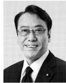
ながさわ ひろあき 現 参院災害対策特別委員長、参院議員1期、東洋大学卒、57歳。 庶民とともに行く。