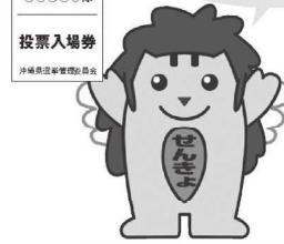
※投票入場券の様子は市町村によって異なります。