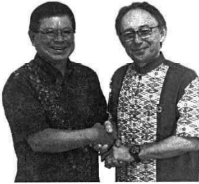
原点を忘れず玉城デニー知事と共に 沖縄の未来を拓く