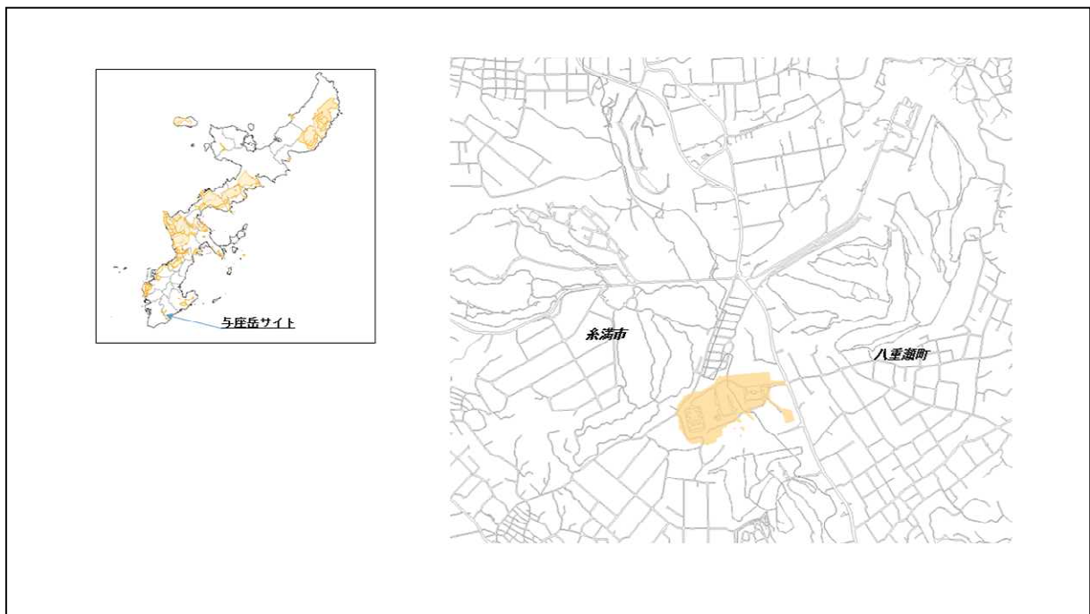
図 71-1 与座岳サイトの位置図（昭和47年時）

( http://www.mofa.go.jp/mofaj/area/usa/sfa/kyoutei/pdfs/02_03.pdf ) を参照