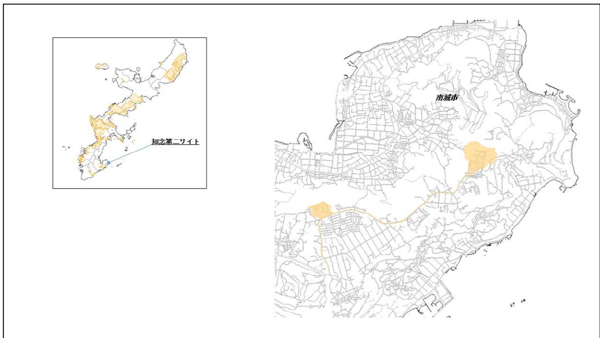
図 67-1 知念第二サイトの位置図（昭和47年時）

( http://www.mofa.go.jp/mofaj/area/usa/sfa/kyoutei/pdfs/02_03.pdf ) を参照