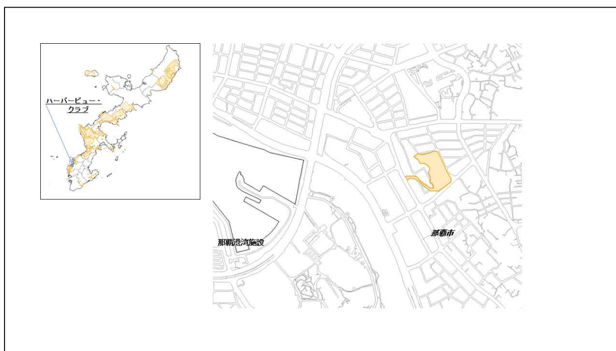
図 61-1 ハーバービュー・クラブの位置図（昭和47年時）

( http://www.mofa.go.jp/mofaj/area/usa/sfa/kyoutei/pdfs/02_03.pdf ) を参照