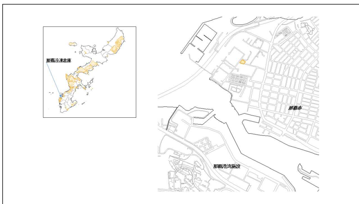
図 60-1 那覇冷凍倉庫の位置図（昭和47年時）

( http://www.mofa.go.jp/mofaj/area/usa/sfa/kyoutei/pdfs/02_03.pdf ) を参照