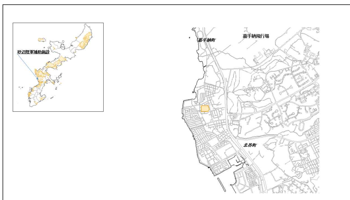
図 38-1 砂辺陸軍補助施設の位置図（昭和47年時）

（ http://www.mofa.go.jp/mofaj/area/usa/sfa/kyoutei/pdfs/02_03.pdf ）を参照