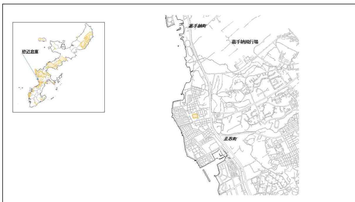
図 37-1 砂辺倉庫の位置図（昭和47年時）

( http://www.mofa.go.jp/mofaj/area/usa/sfa/kyoutei/pdfs/02_03.pdf ) を参照