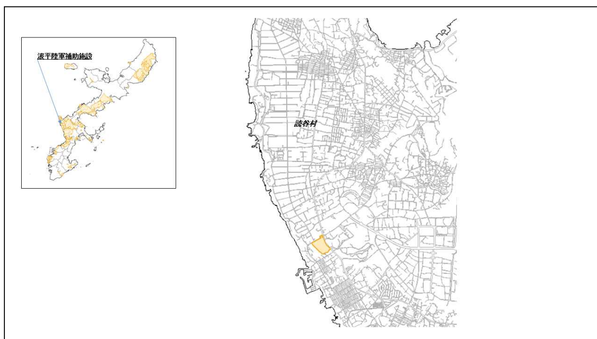
図 33-1 波平陸軍補助施設の位置図（昭和47年時）

（ http://www.mofa.go.jp/mofaj/area/usa/sfa/kyoutei/pdfs/02_03.pdf ）を参照