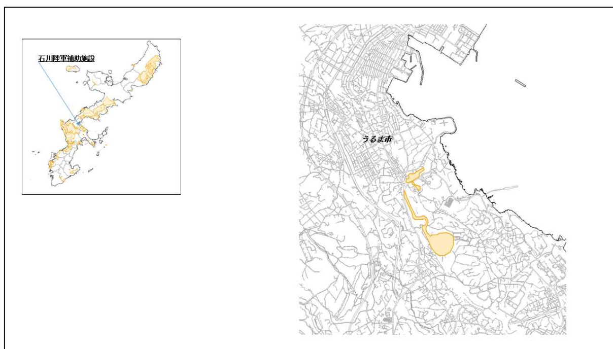
図 22-1 石川陸軍補助施設の位置図（昭和47年時）

( http://www.mofa.go.jp/mofaj/area/usa/sfa/kyoutei/pdfs/02_03.pdf ) を参照