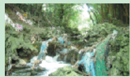
こみがたまっている様子(浦添市当山)

ここに載っているのは牧港川のほんの一部です。実際に君の目で見るとどのように映るかな。さあ、出かけてみよう！ 編集:沖縄県文化環境部環境保全課 平成21年3月印刷