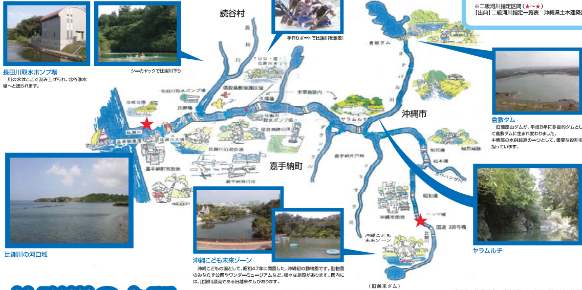
長田川取水ポンプ場 川の水はここで汲み上げられ、北谷浄水場へと送られます。