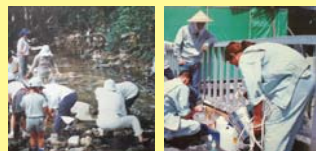
水生生物の調査の様子