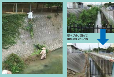
初夏の比謝川上流清掃

比謝川に清流を取り戻したい。顔が洗える川にしよう。その思いから1974年に発足した会です。どのような運動をしたら比謝川に清流が戻るのかということ、手探りの状態から会員の皆で知恵を出し合いました。年に4回の定期河川調査や水質検査や比謝川清掃デー、川と水と人間と(1集~4集)の発行などさまざまな活動をしています。