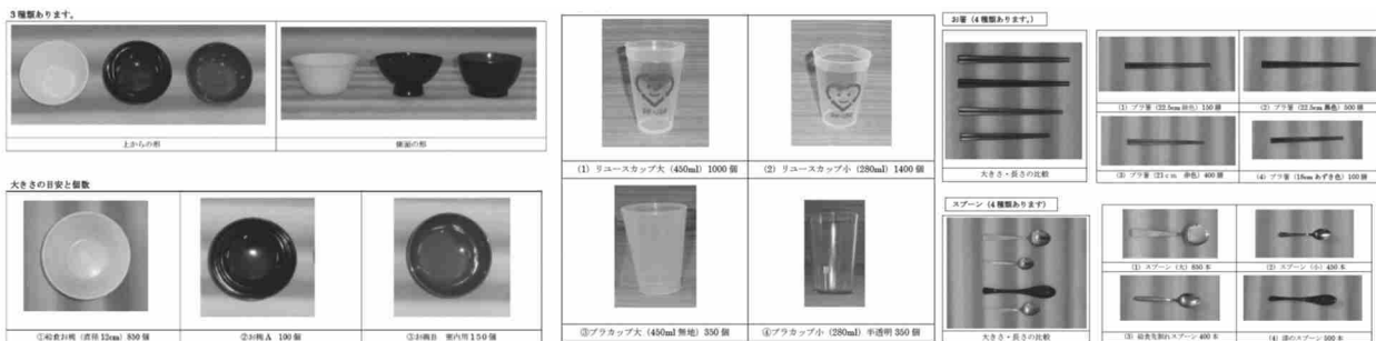
引用：エコマール那覇プラザ棟ホームページより

イベントで使う使い捨て食器の削減のために、再利用できる食器を利用する。沖縄では、エコマール那覇プラザ棟で、平成12年からリユース食器の貸し出しを行っている。（有料）