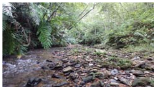
自然のままの川の流れ