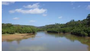
国指定天然記念物のマングローブ