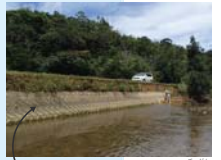
コンクリートでつくられた護岸

護岸をつくったり、川の流れをまっすぐにしたため、水際の植物がなくなったり、瀬や淵がなくなってしまう、生き物のすみかが少なくなっていました。