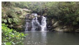
慶佐次川中流にある滝

自然が失われつつある慶佐次川ですが、まだ自然が残っているところもあり、貴重な生き物もすんでいます。こうした自然を残すため、赤土の流出や水の汚れをなくし、昔ながらの川の状態に戻していくことが大事です。