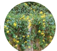
コウシュンカズラ