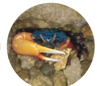
ルリマダラシオマネキ