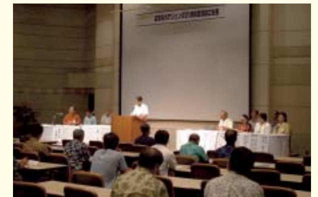
Conserving the global environment through partnerships and cooperation (Okinawa Agenda 21 Prefectural Assembly)