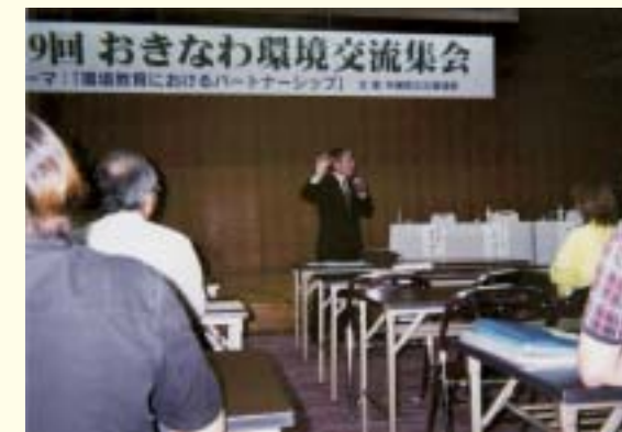
Networking for environmental conservation (An Okinawa Environment Information Meeting)

Each sector needs to proactively implement the guidelines for environmental consideration set out under this Plan.