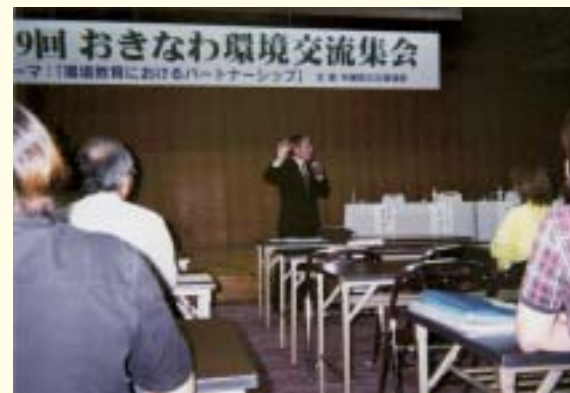
環境保全のためのネットワークの構築 (おきなわ環境交流集会の開催)

このため、各主体は本計画で示す環境への配慮指針を参考に積極的に行動する必要があります。