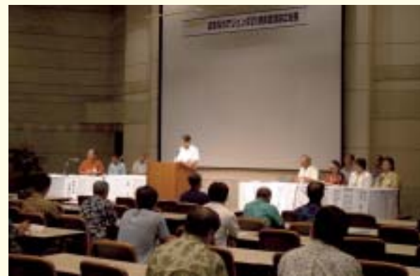
各主体の連携・協力による地球環境保全への取り組み (おきなわアジェンダ21 県民会議の開催)