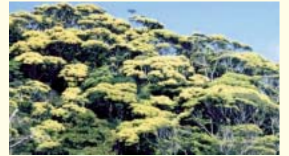
Itajii woods of the Yanbaru area (Kunigami Village)