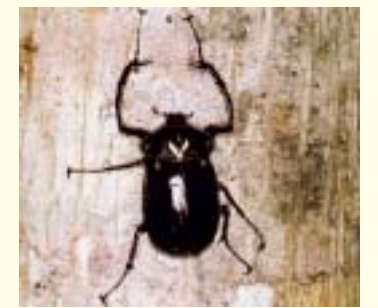
Yambaru long-armed scarab beetle