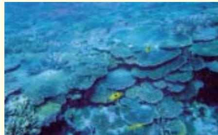
サンゴ礁(八重山の石西礁湖)