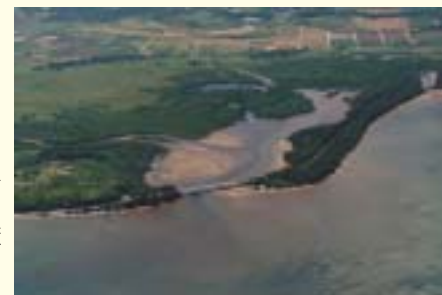
名蔵アンパル(石垣島)