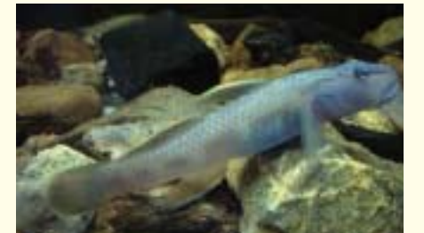
Blue Belly middle egg-goby