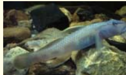
アオバラヨシノボリ