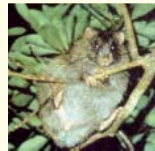
Ryukyu long-tailed giant rat