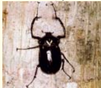
ヤンバルテナゴコガネ