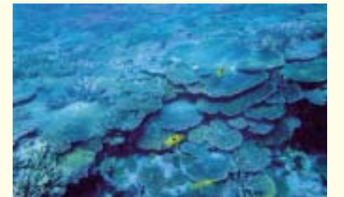
Coral reef (Sekisei Lagoon in Yaeyama)