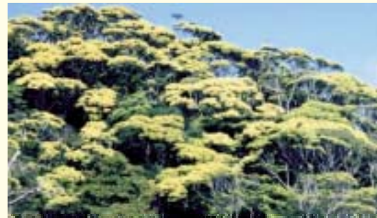
やんばるのイタジイ林(国頭村)