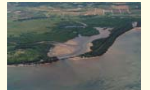
Nagura Anparu tideland (Ishigaki Island)