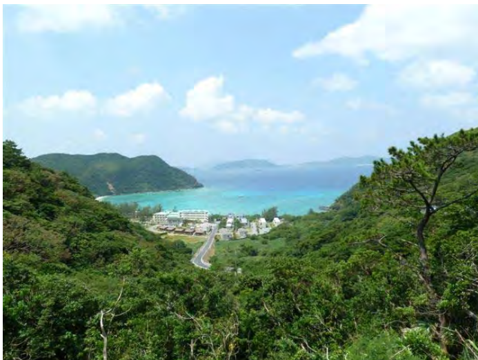
森と海と集落が織りなす離島の景観（渡嘉敷村）