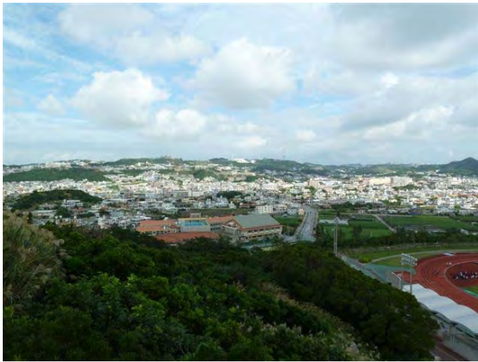
市街地に点在する森林緑地（南風原町）