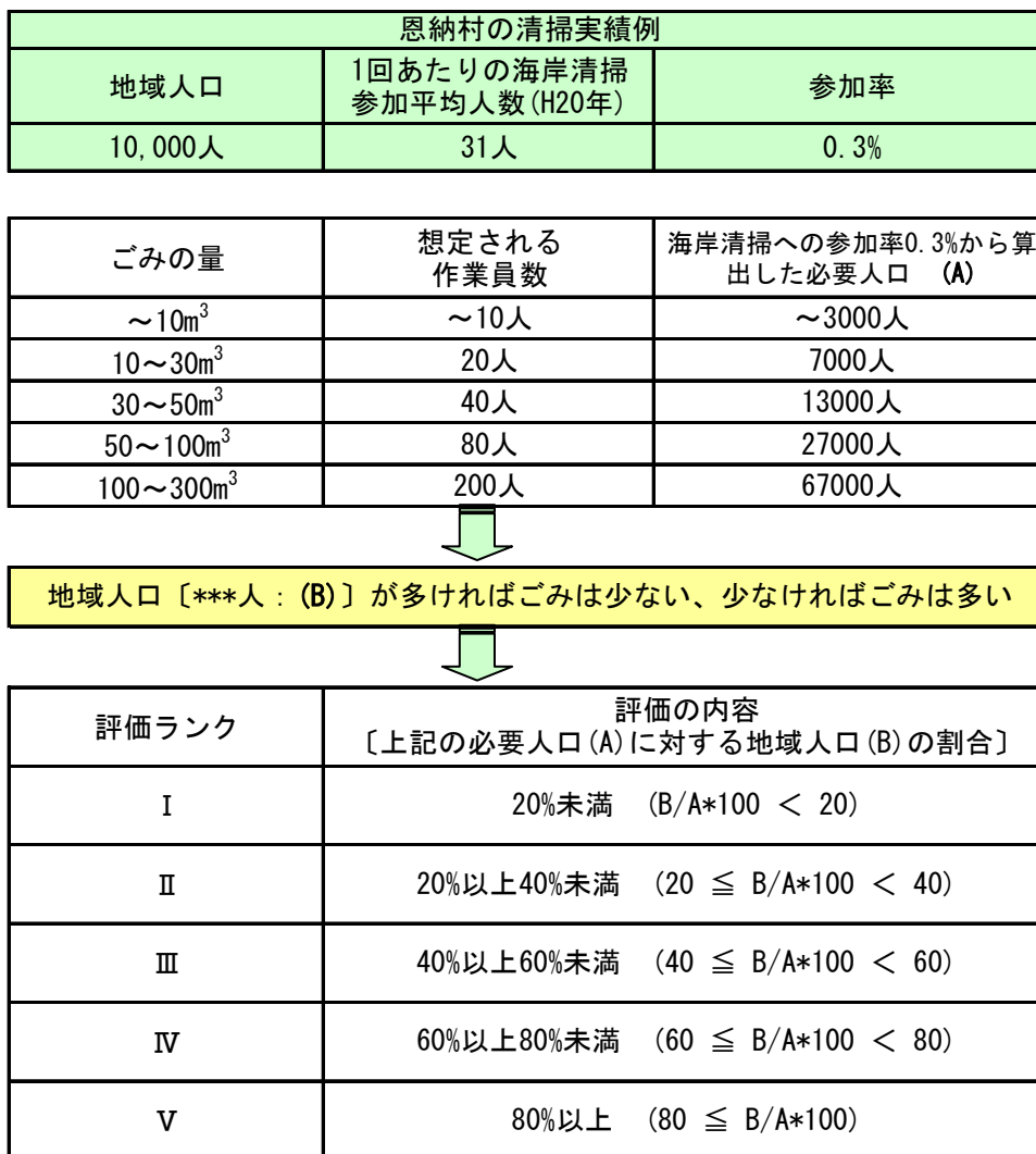
図1 海岸漂着物の量の評価基準 [沖縄本島及び本島周辺離島地域]

恩納村のボランティア活動事例から、海岸清掃の参加率を0.3%とし、回収効率を、環境省モデル調査結果を参考に1人1日あたりの回収量を 1\text{m}^3 とする。