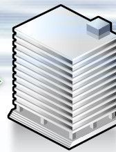
経済産業省 産業保安監督部長

http://www.meti.go.jp/policy/safety_security/industrial_safety/links/kantokubu.html