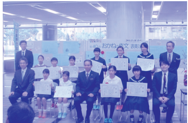
〈表彰式〉平成28年2月5日(金) 小学校低学年の部・高学年の部、 中学校の部、特選 秀作 入選者