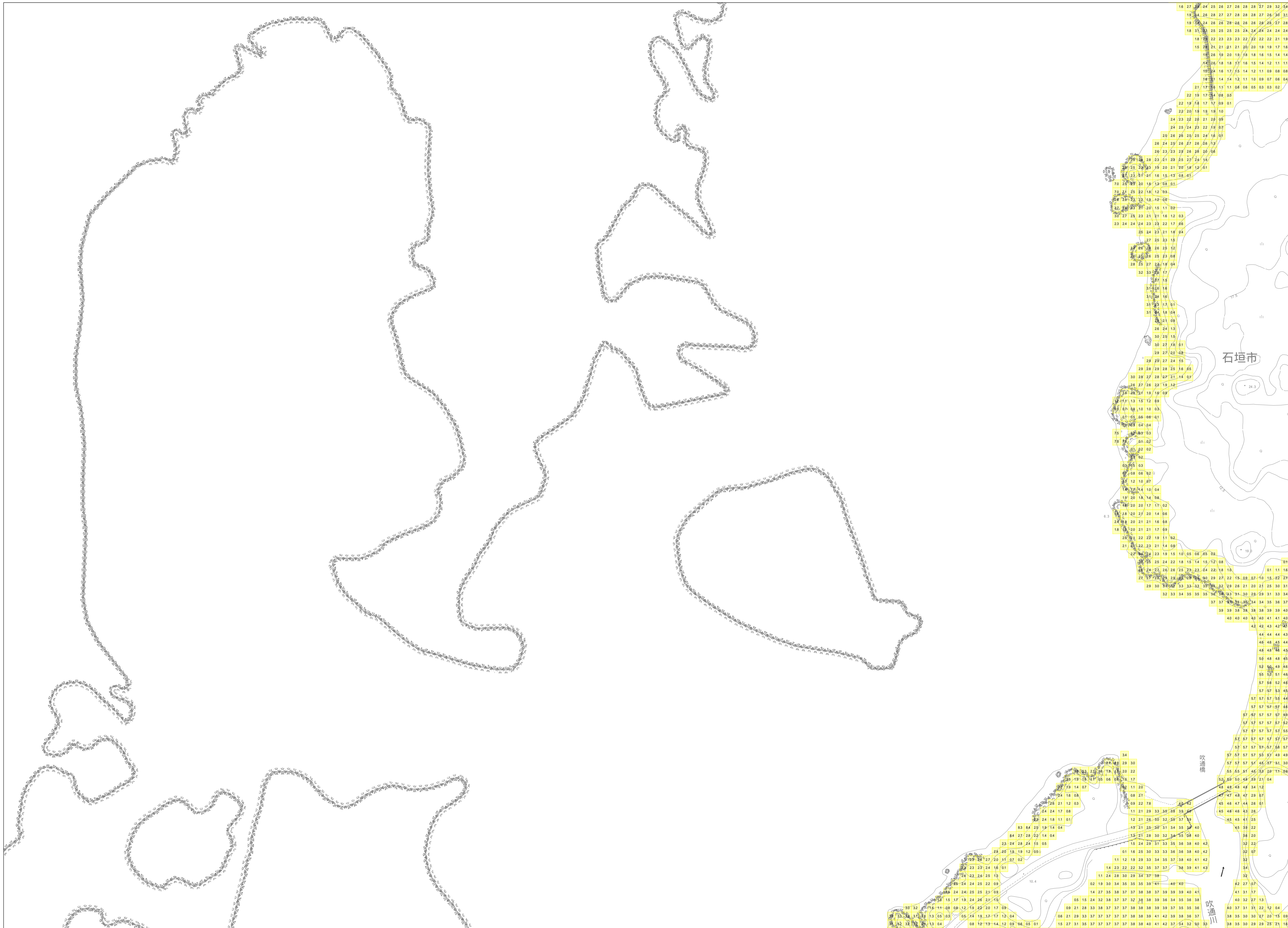
この地図は、沖縄県数値地形図を使用したものである。(平28企情第334号)