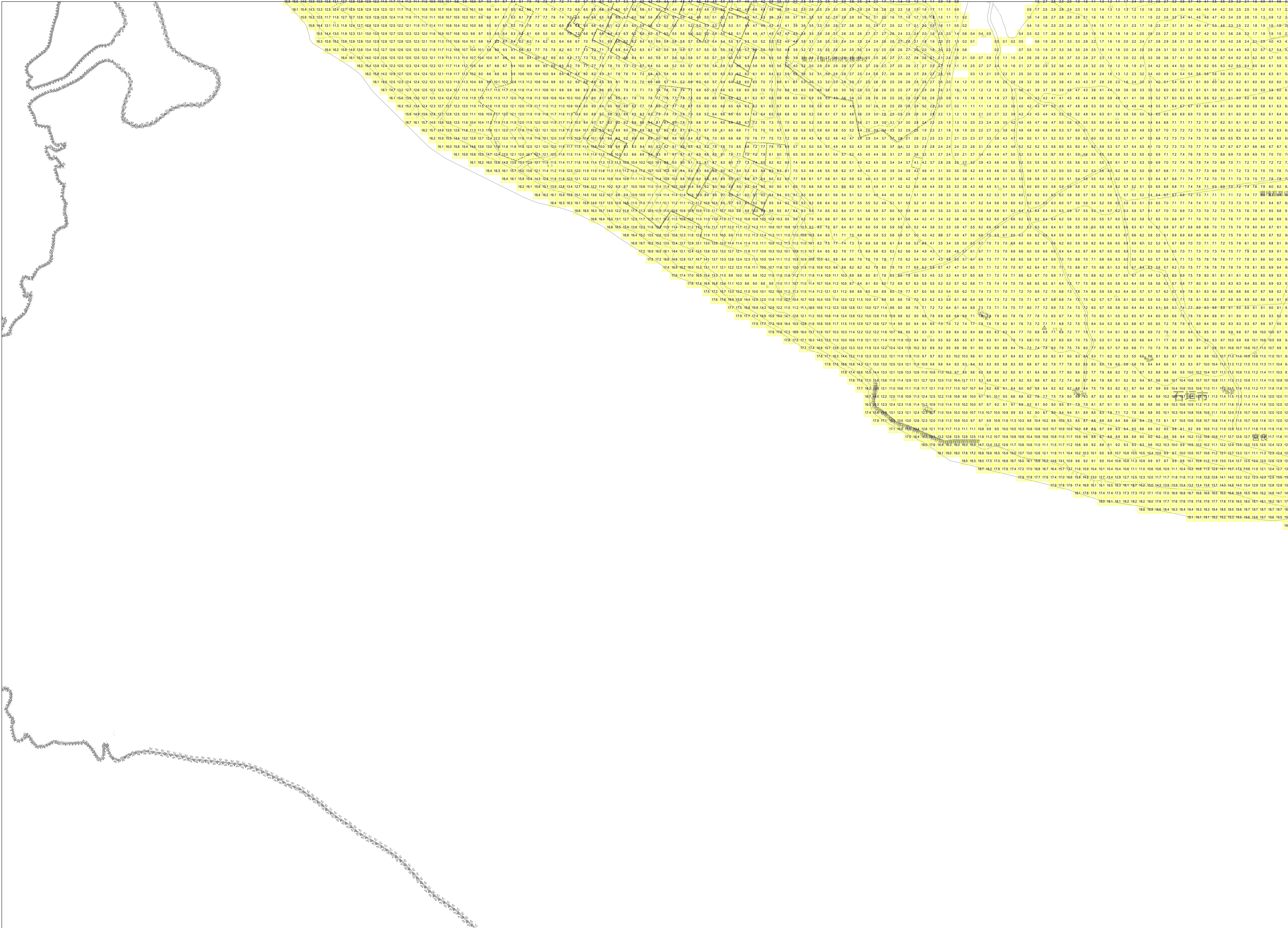
この地図は、沖縄県数値地形図を使用したものである。(平28企情第334号)