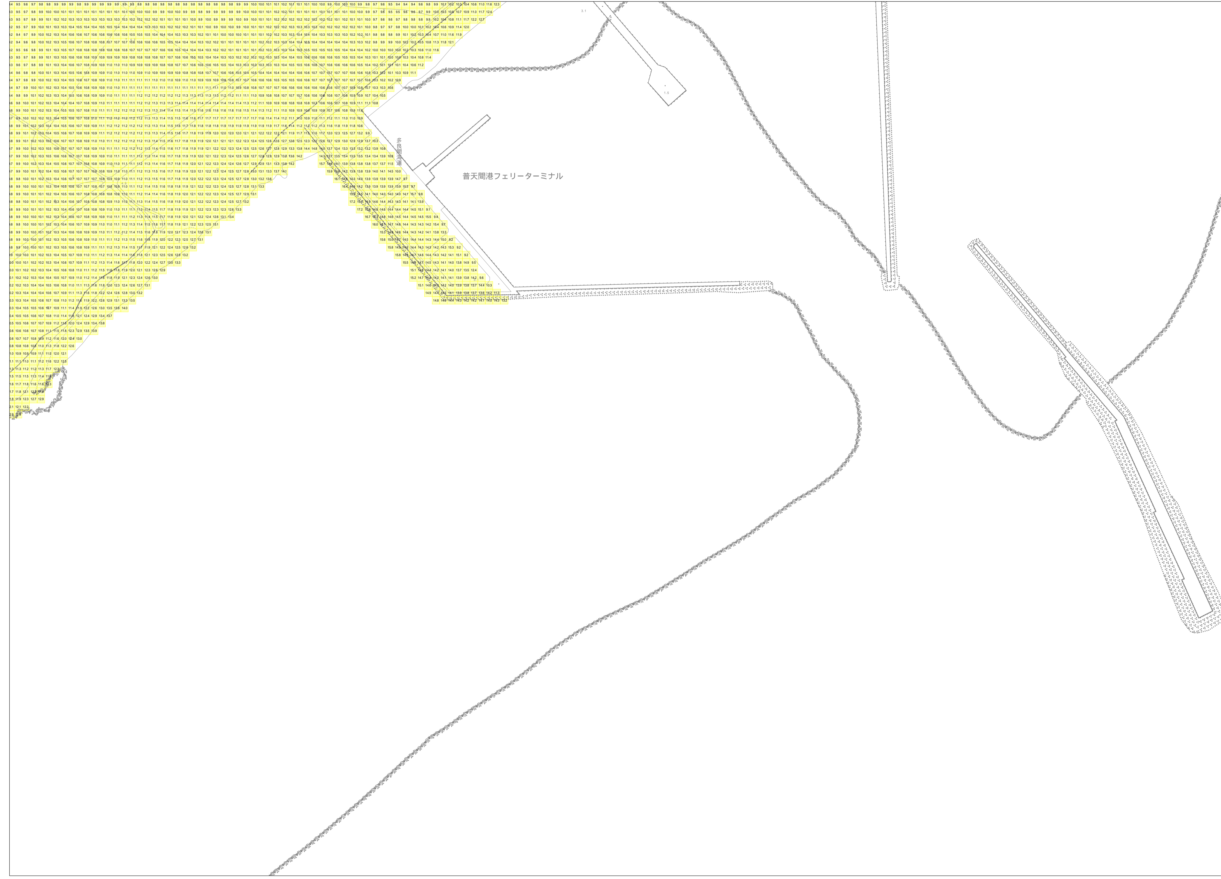
この地図は、沖縄県数値地形図を使用したものである。(平28企情第334号)