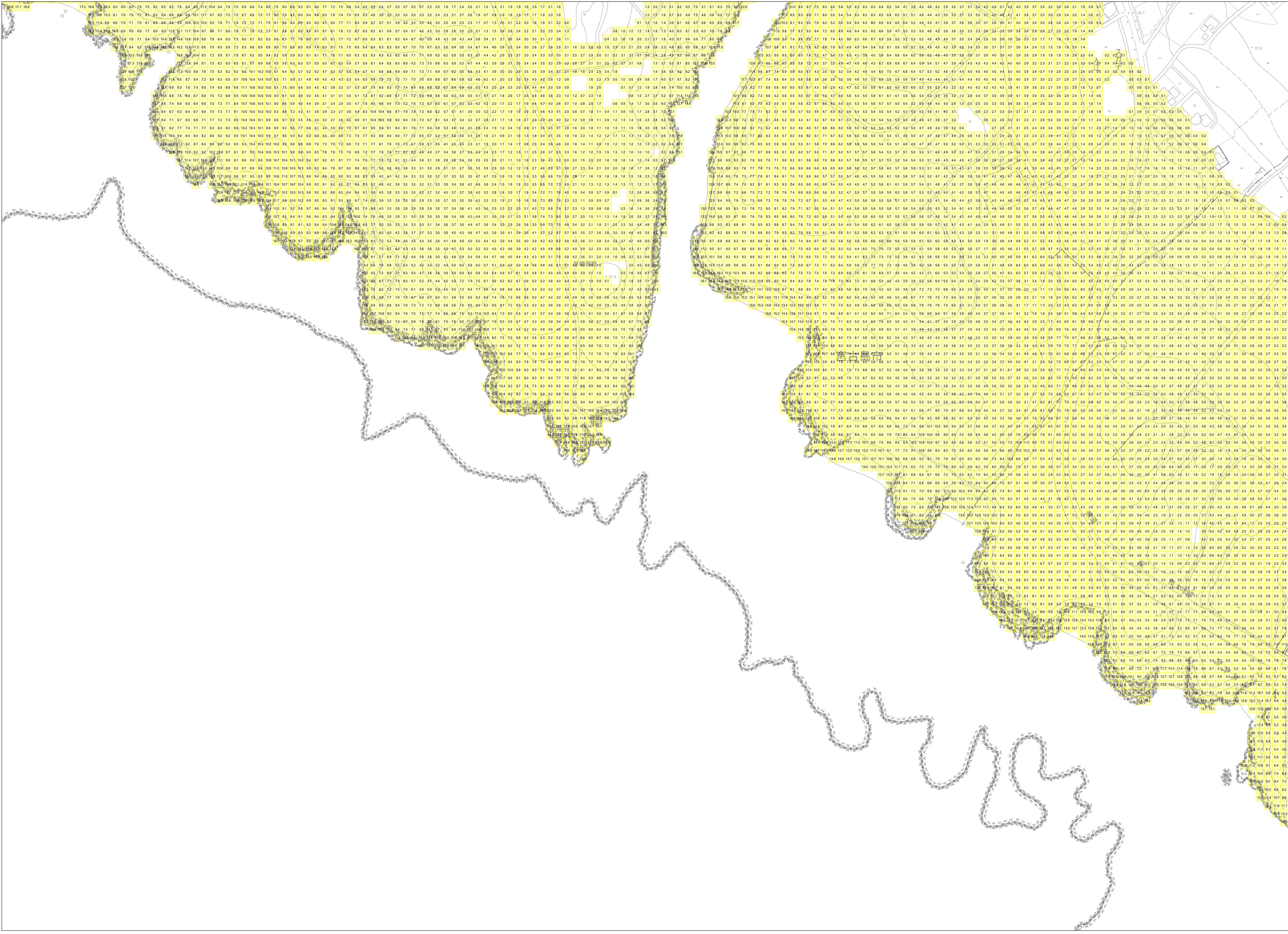
この地図は、沖縄県数値地形図を使用したものである。(平28企情第334号)