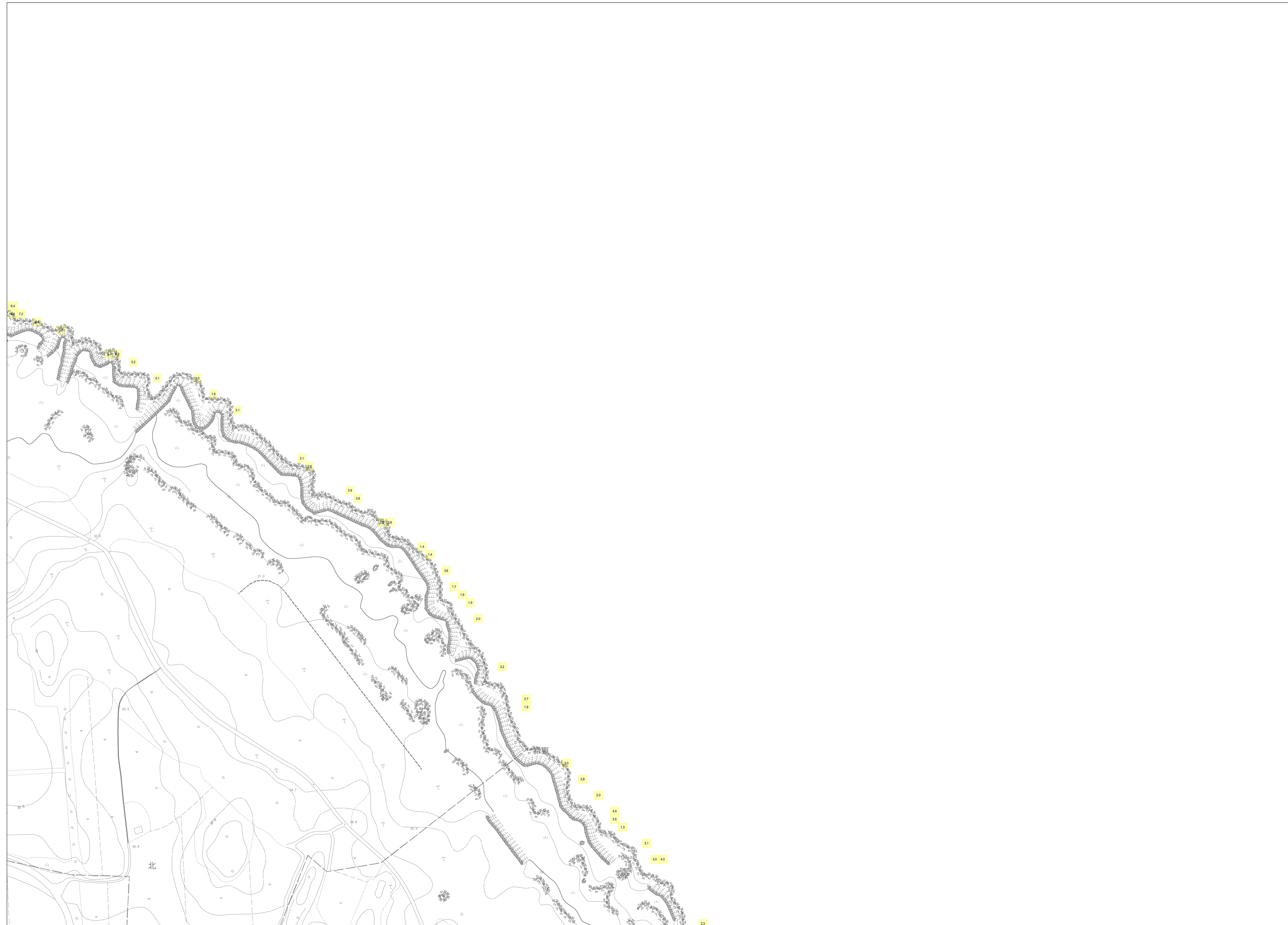
この地図は、沖縄県数値地形図を使用したものである。(平28企情第334号)