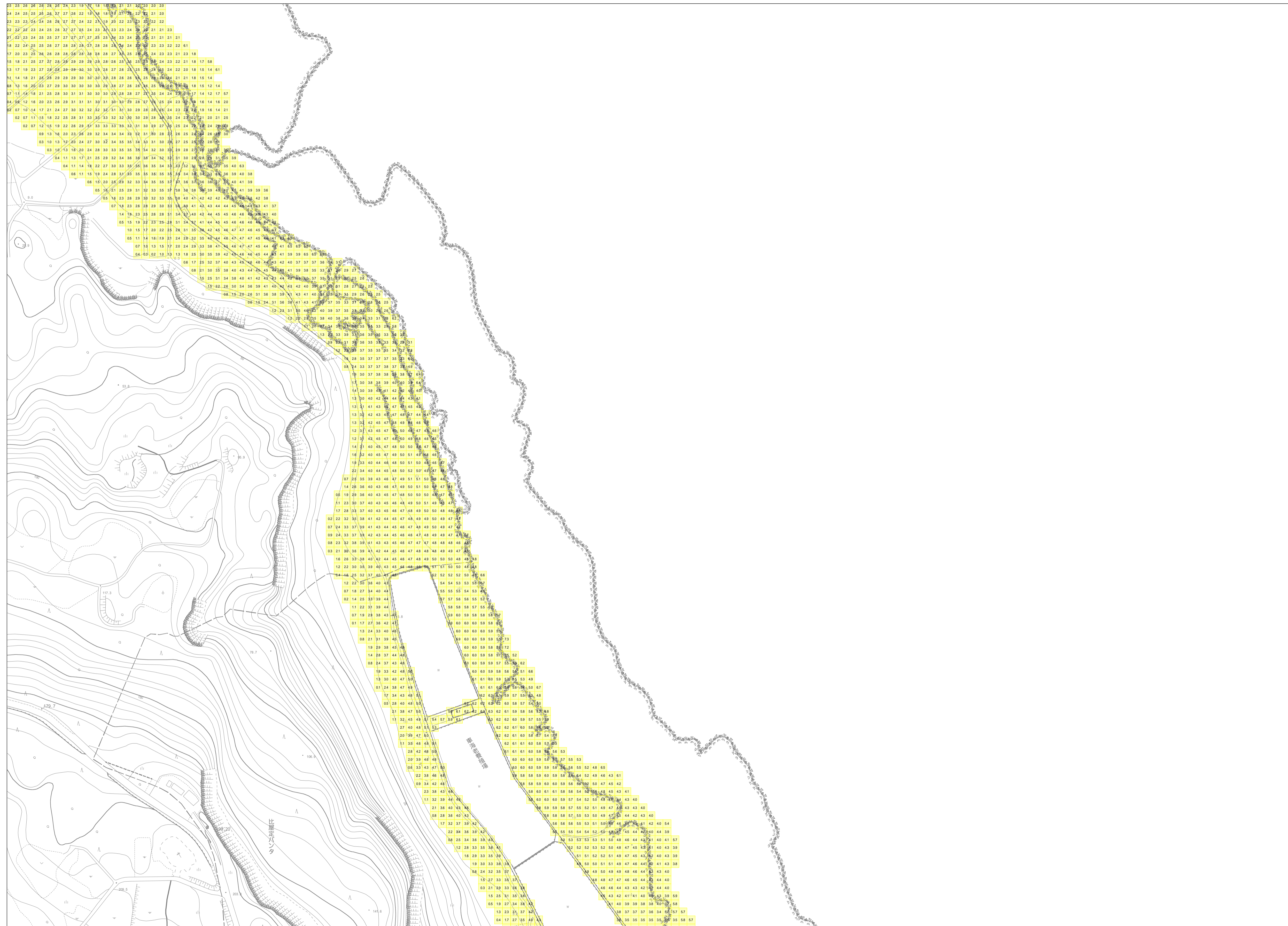
この地図は、沖縄県数値地形図を使用したものである。(平 28企情第 334号)