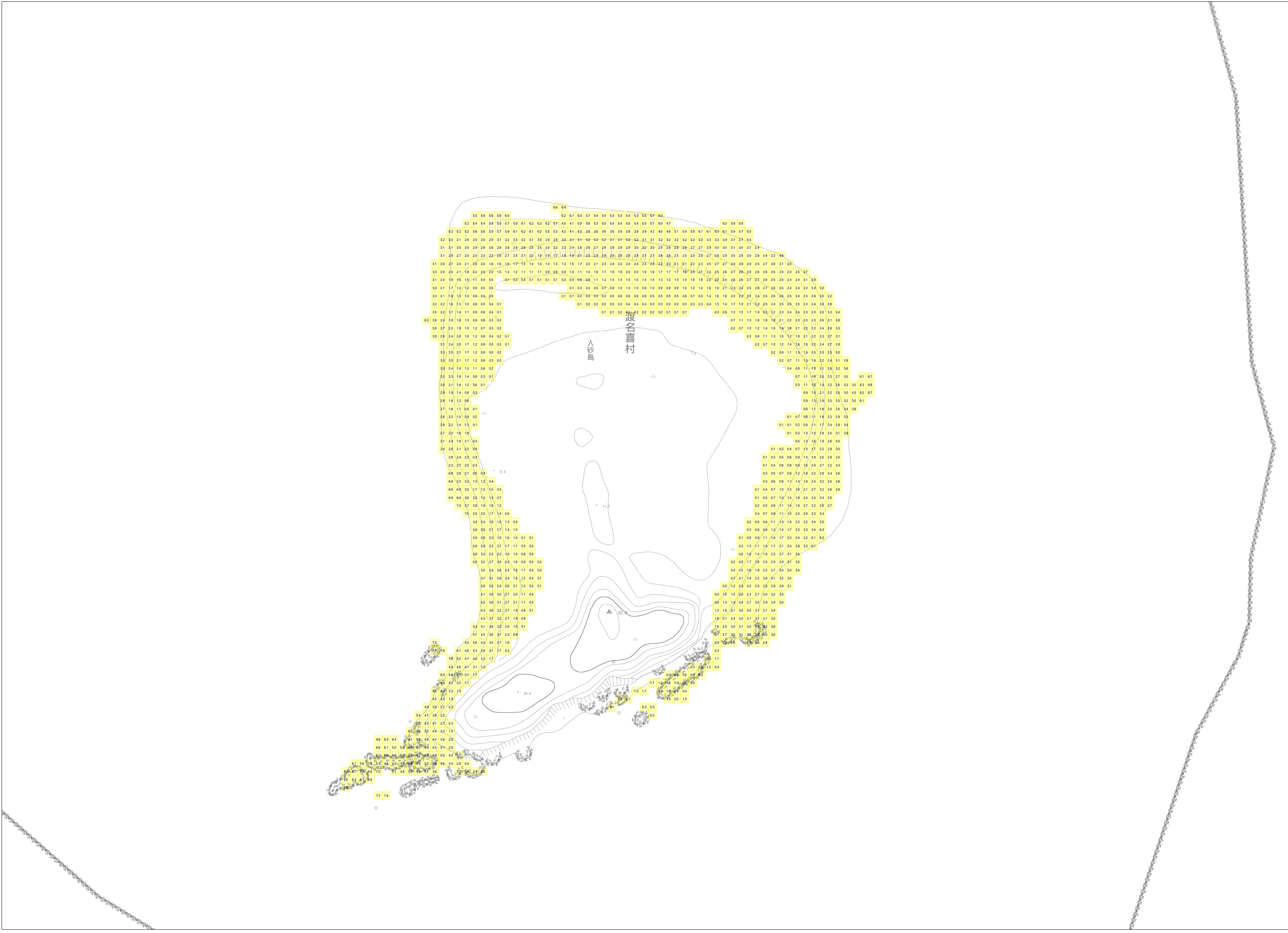
この地図は、沖縄県数値地形図を使用したものである。(平28企情第334号)