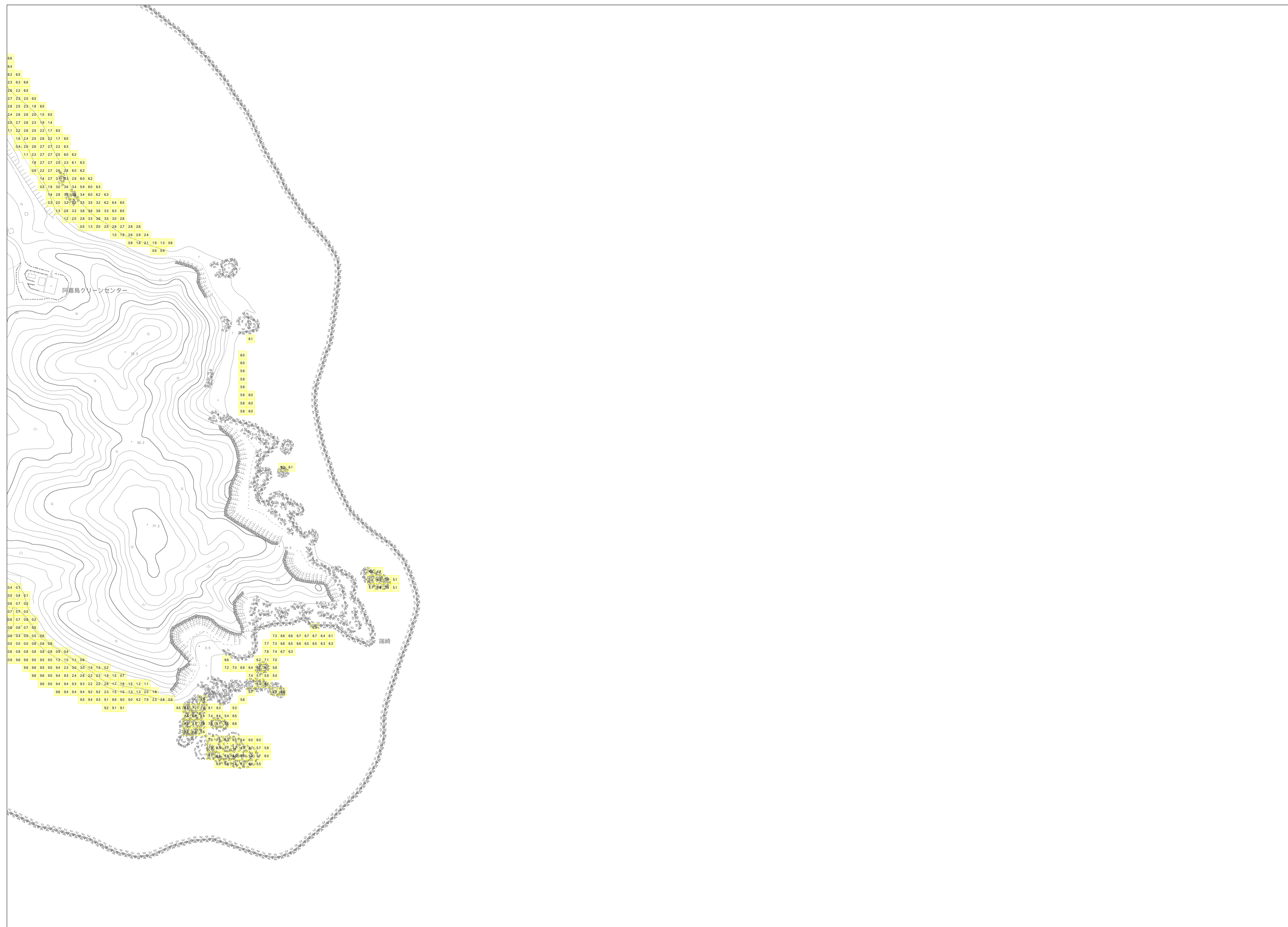
この地図は、沖縄県数値地形図を使用したものである。(平28企情第334号)