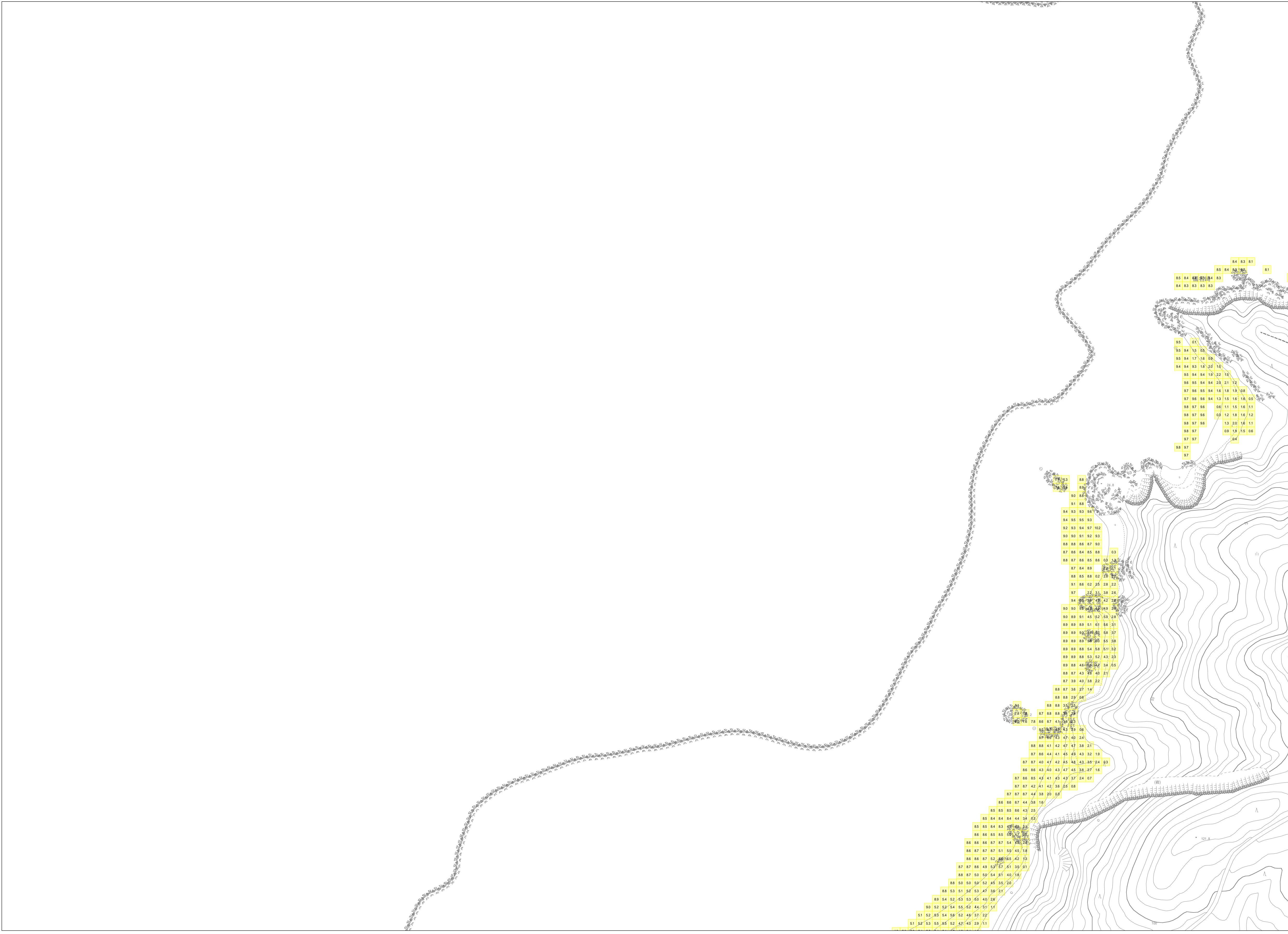
この地図は、沖縄県数値地形図を使用したものである。(平28企情第334号)