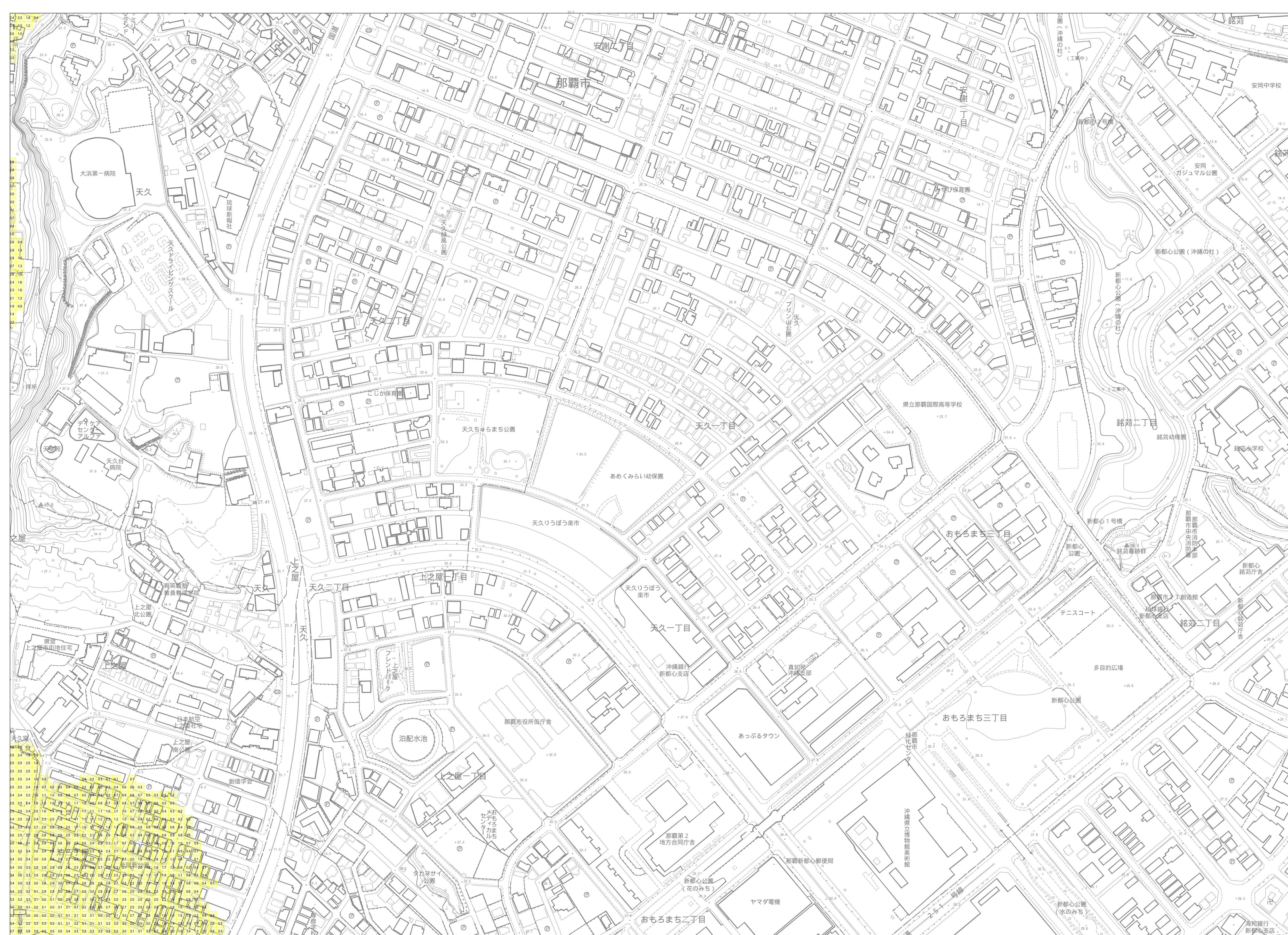
この地図は、沖縄県数値地形図を使用したものである。(平28企情第334号)