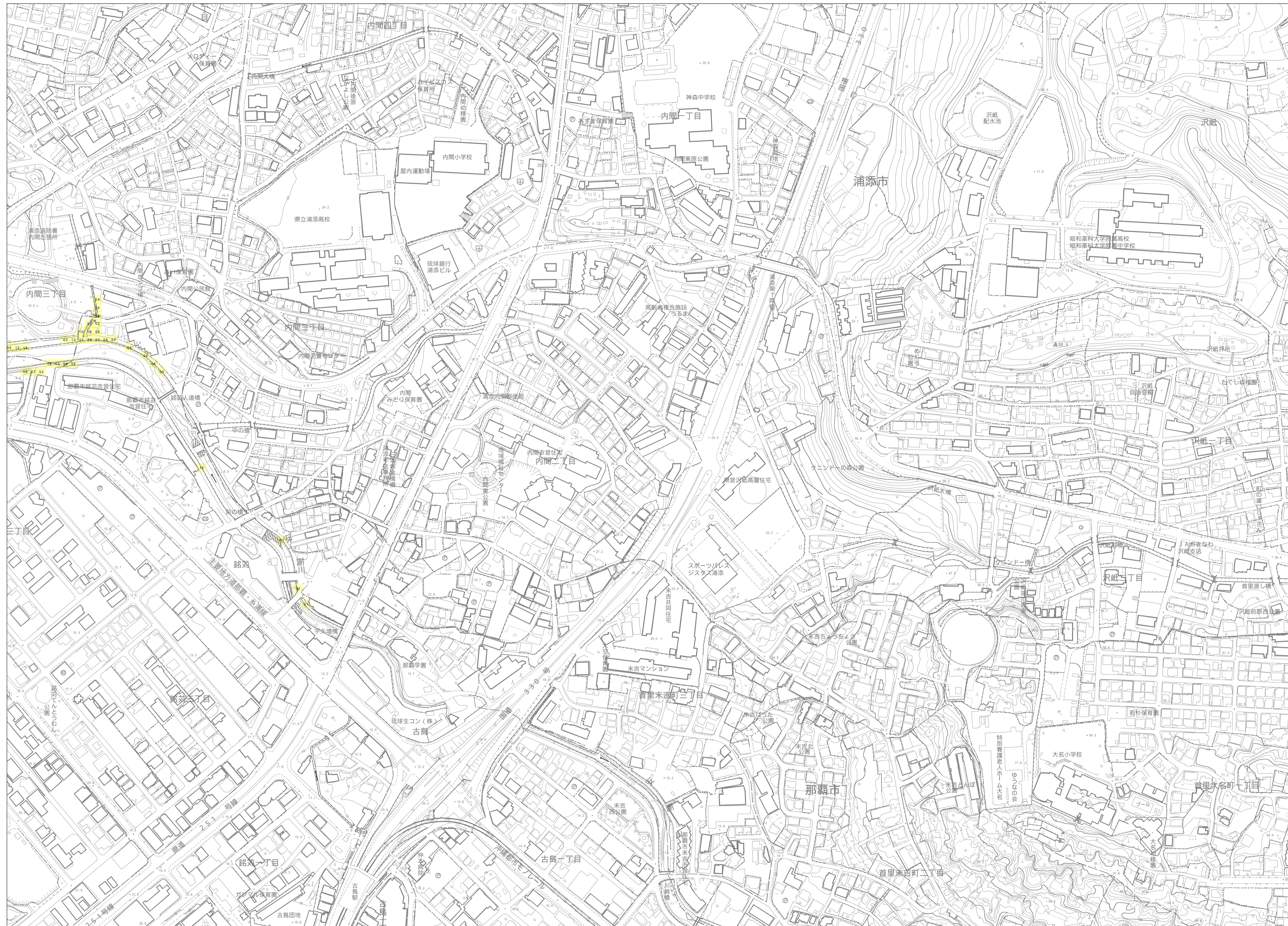
この地図は、沖縄県数値地形図を使用したものである。(平28企情第334号)