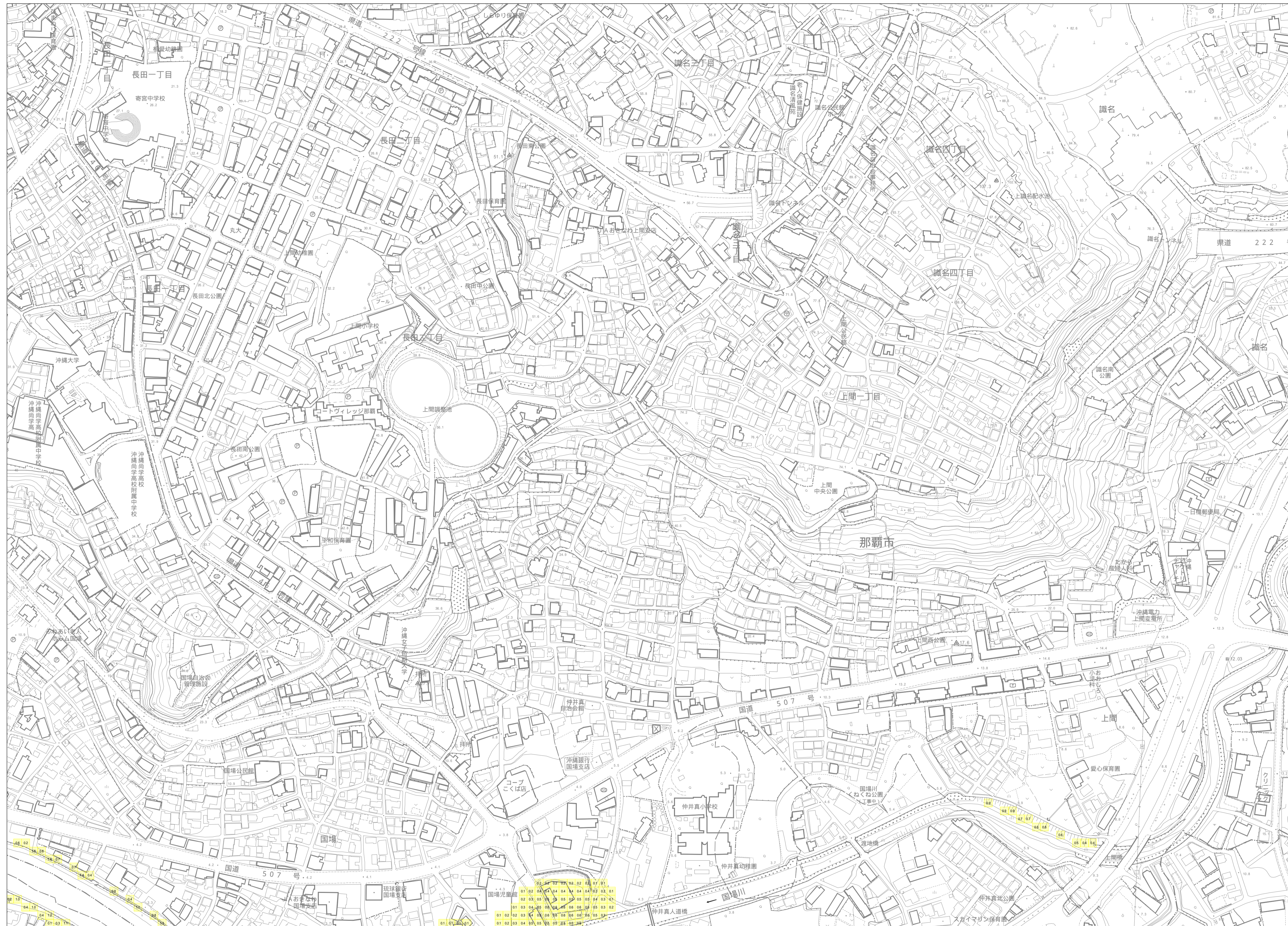
この地図は、沖縄県数値地形図を使用したものである。(平 28企情第 334号)