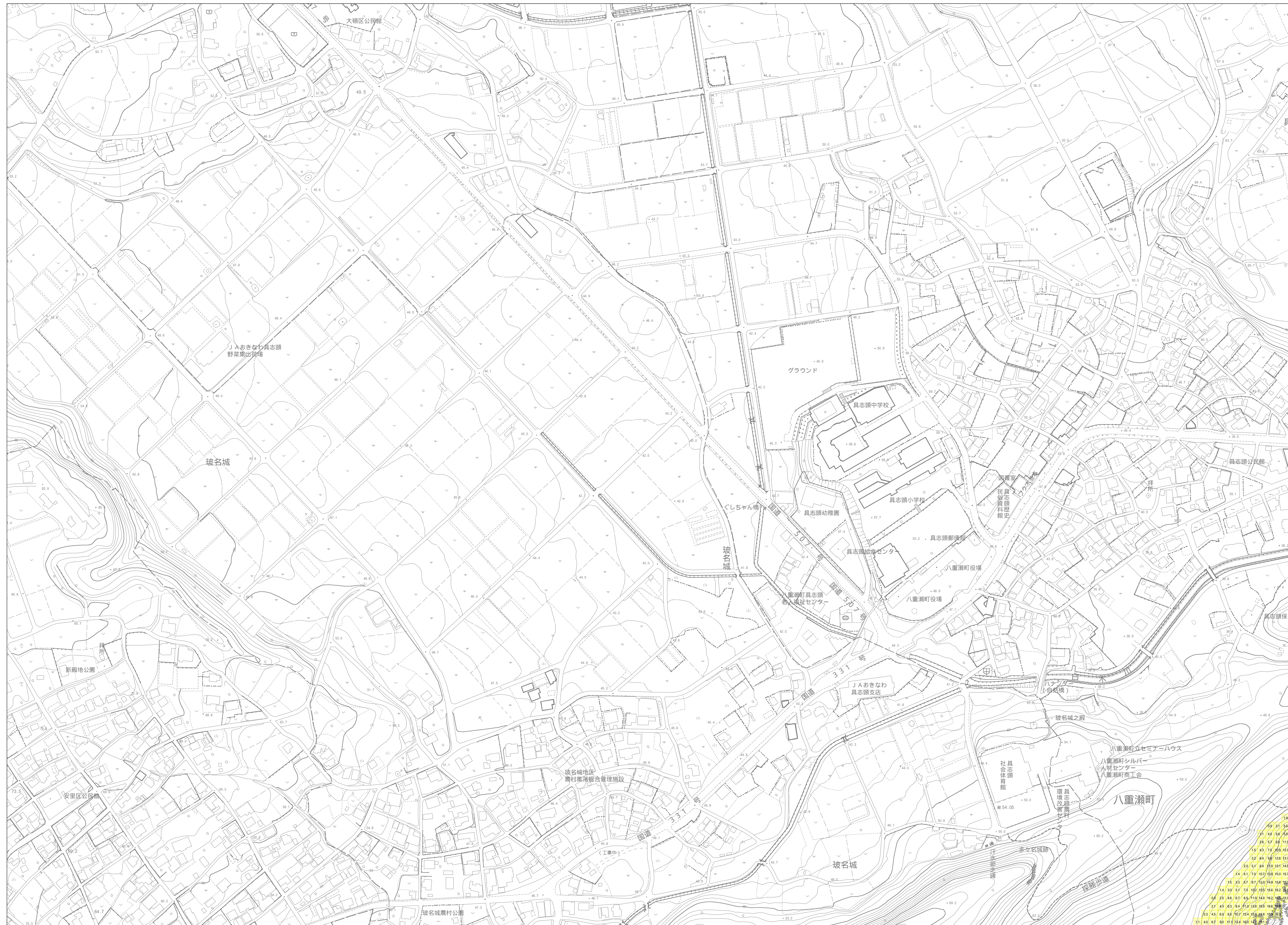
この地図は、沖縄県数値地形図を使用したものである。(平 28企情第 334号)