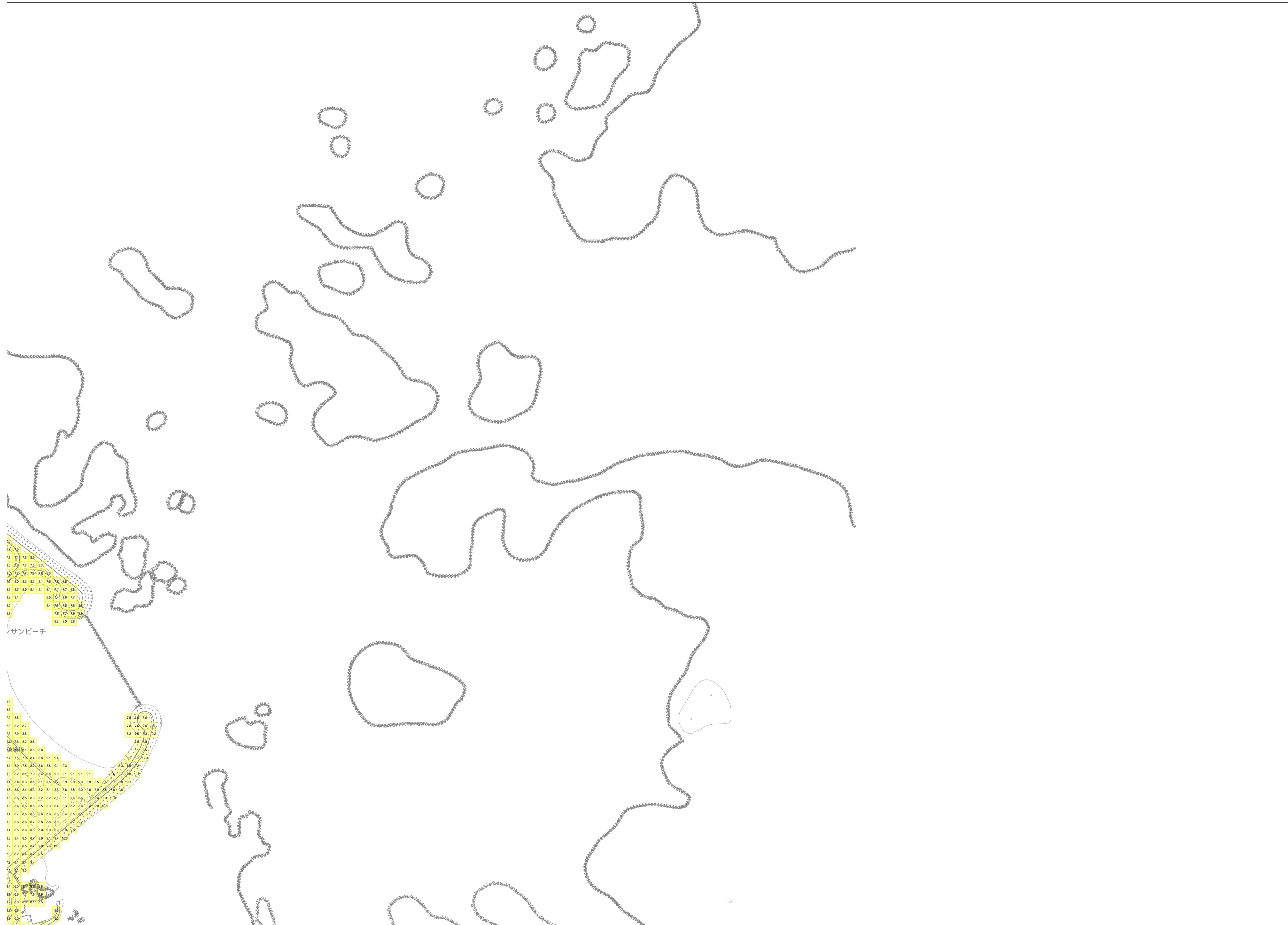
この地図は、沖縄県数値地形図を使用したものである。(平28企情第334号)