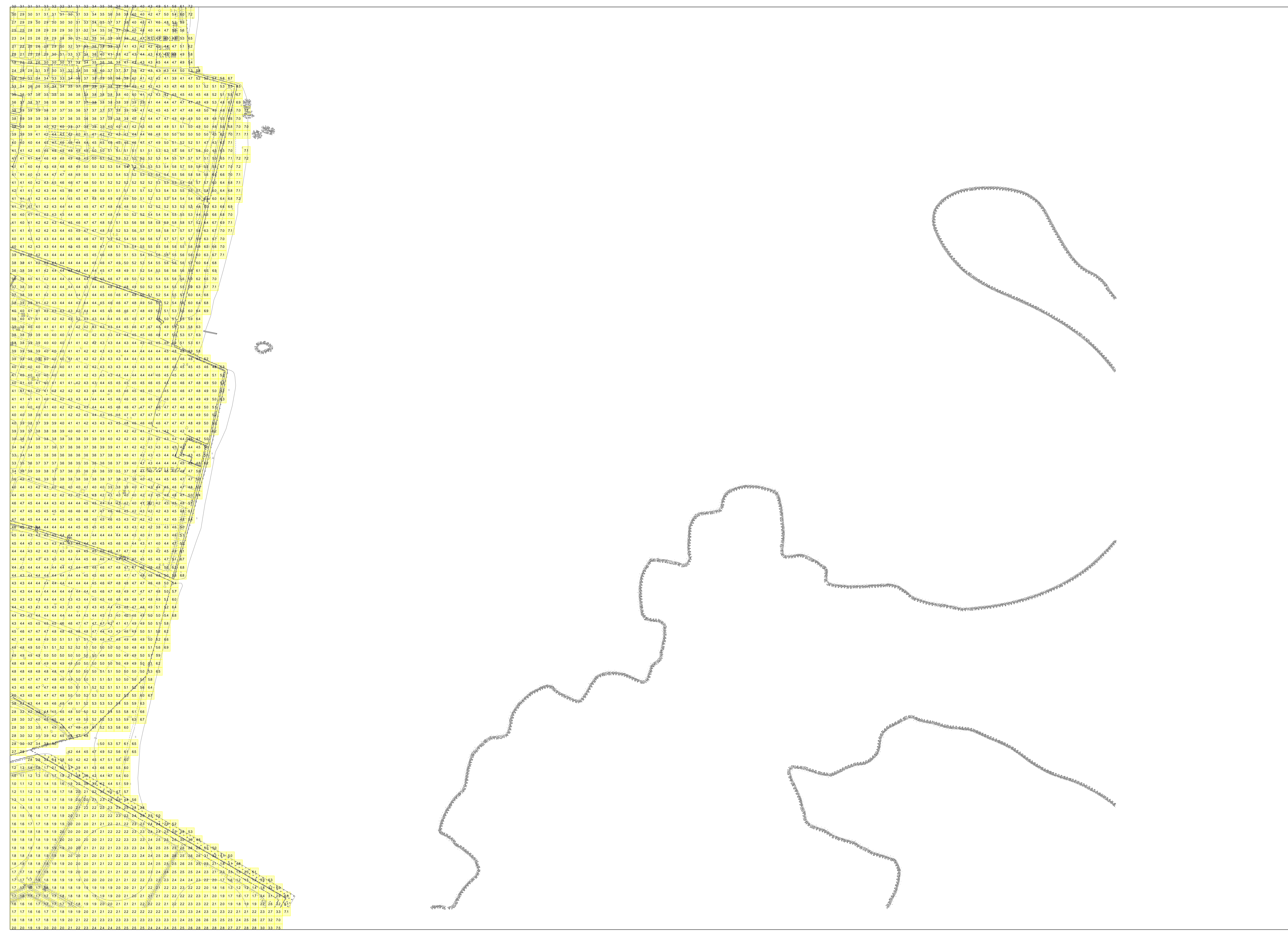
この地図は、沖縄県数値地形図を使用したものである。(平 28企情第 334号)