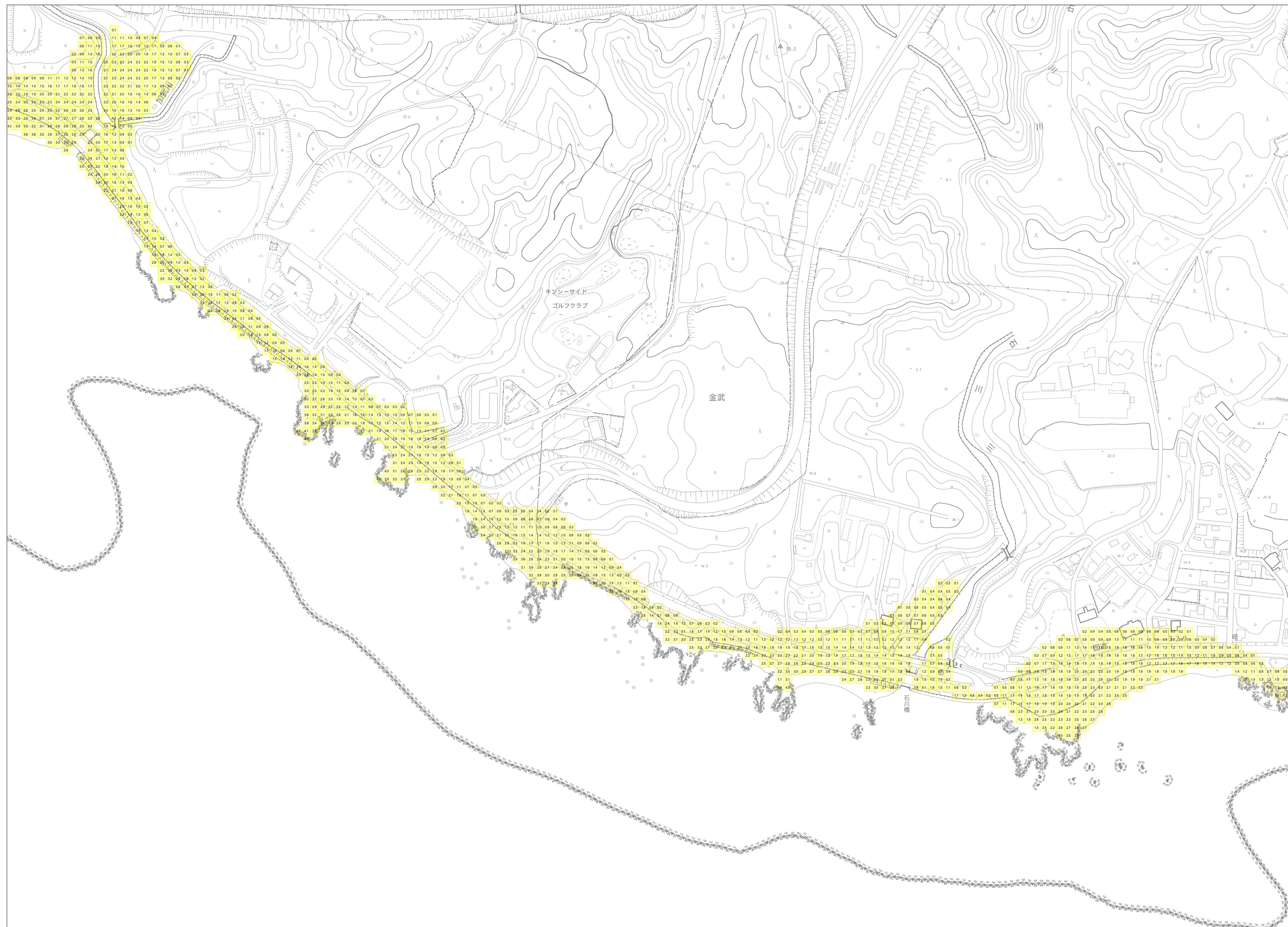
この地図は、沖縄県数値地形図を使用したものである。(平28企情第334号)