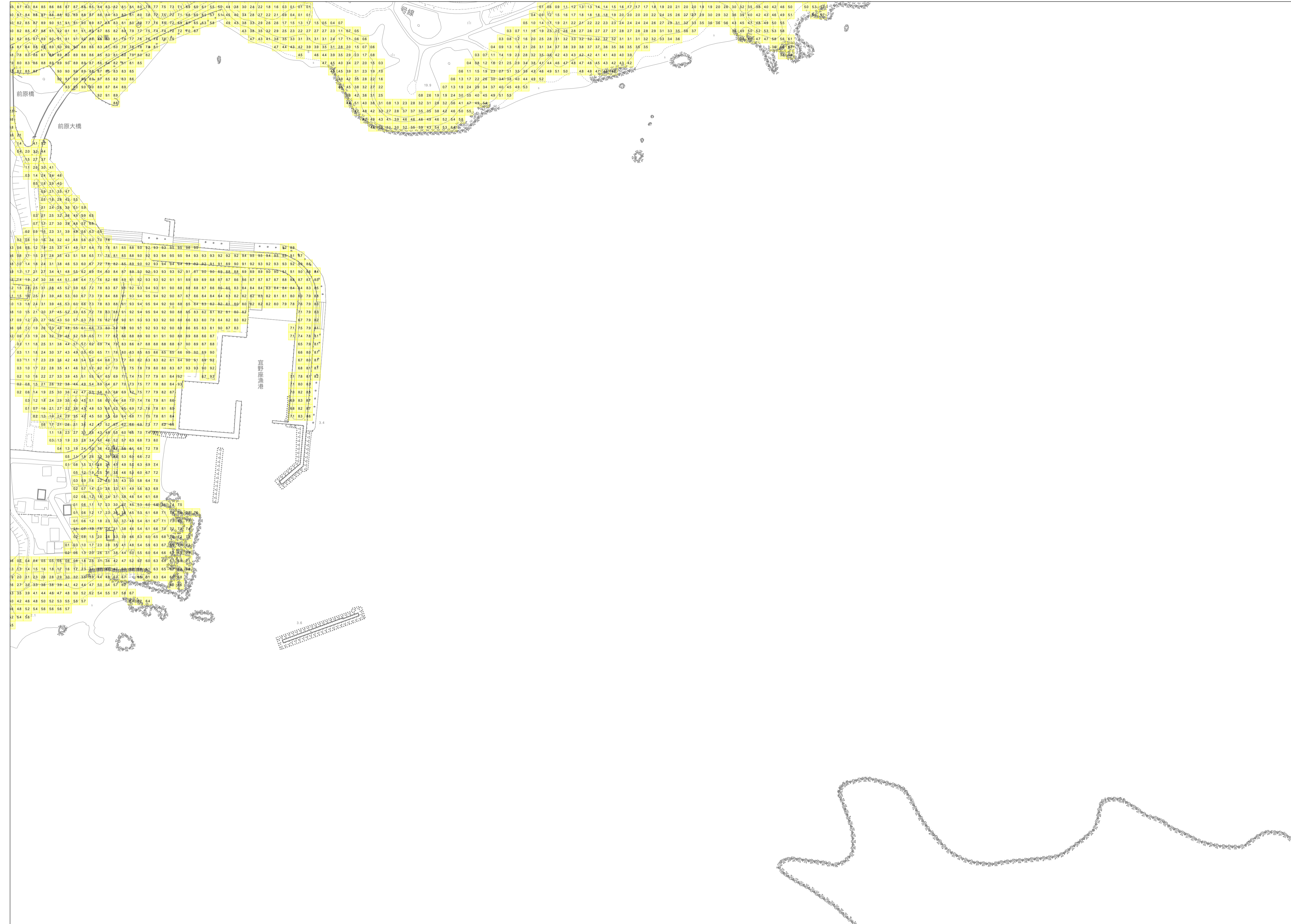
この地図は、沖縄県数値地形図を使用したものである。(平28企情第334号)