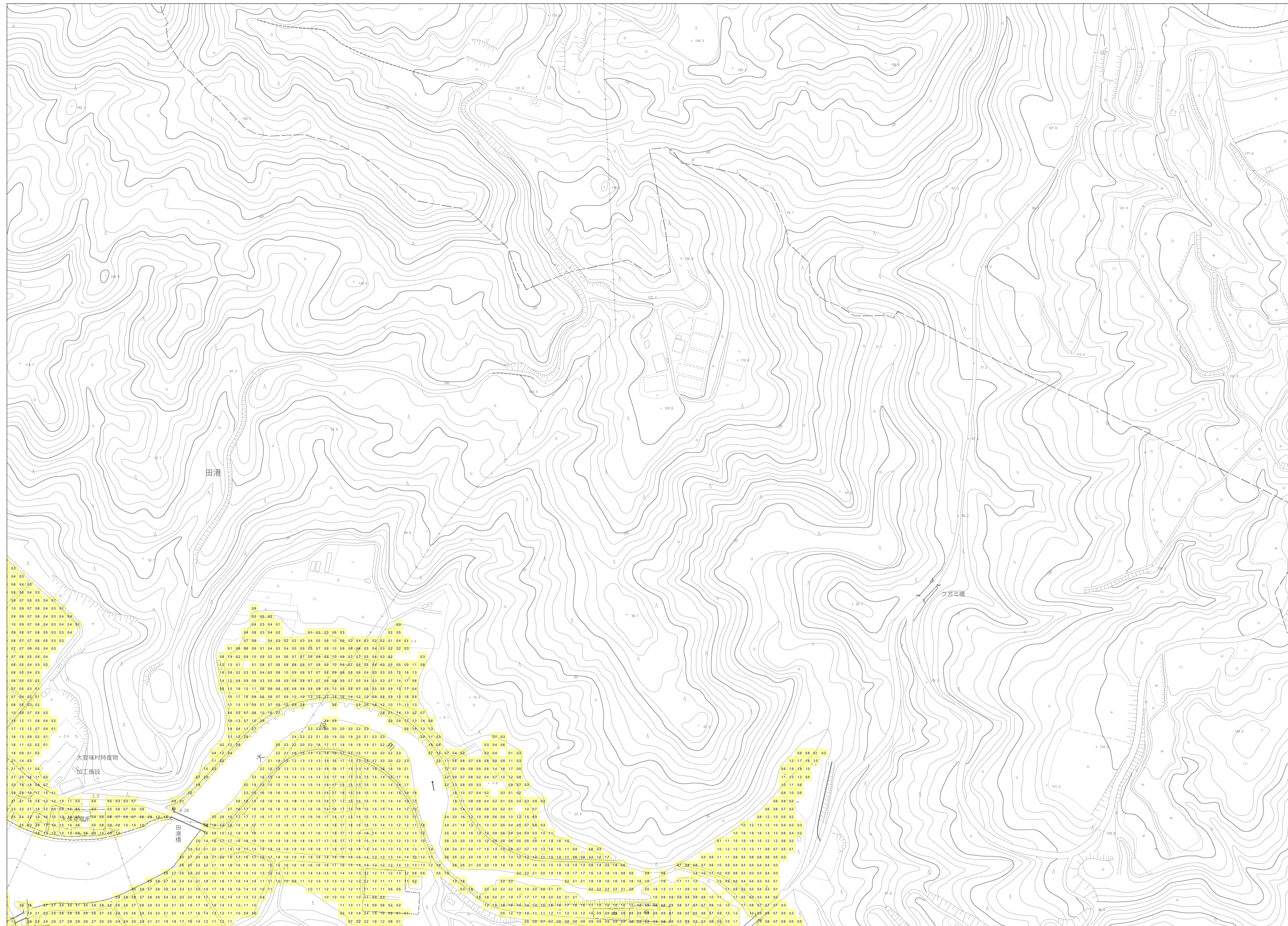
この地図は、沖縄県数値地形図を使用したものである。(平 28企情第 334号)