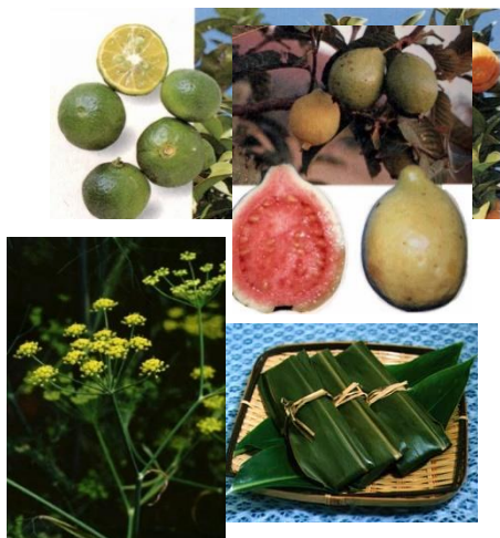
県内企業の使用素材

例： 戦略成分 （GABA、βカロテン） 特保・機能性表示の 関与成分 （ポリフェノール、ケルセチン、カフェ酸、クロロゲン酸類、没食子酸など）